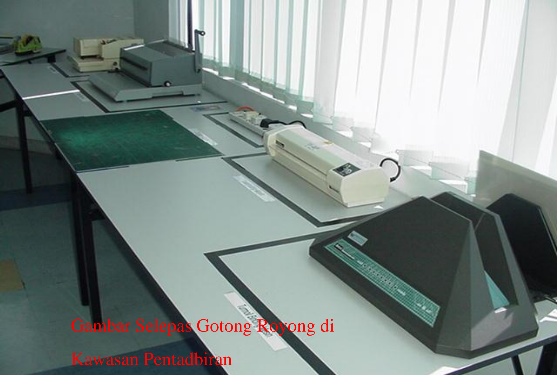
Gambar Selepas Gotong Royong di Kawasan Pentadbiran