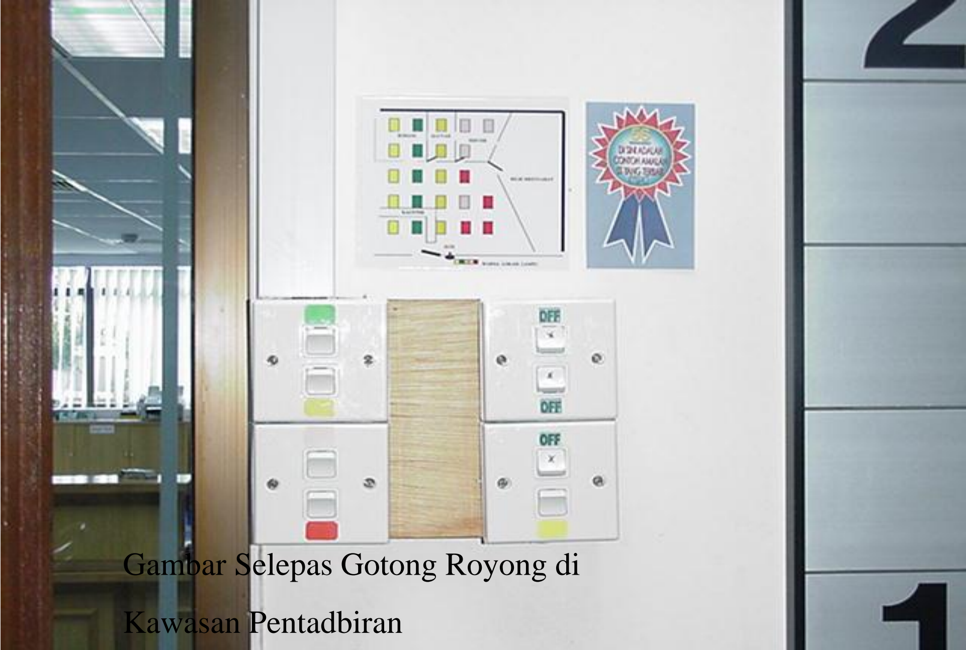
Gambar Selepas Gotong Royong di Kawasan Pentadbiran