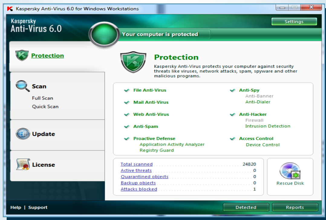
Antivirus yang digunakan, Kaspersky Anti-Virus 6.0 R2.

Terdapat antivirus dalam versi trial yang bertujuan untuk memberi peluang kepada komputer user mencuba keberkesanan produk mereka. Tetapi dalam versi ini, biasanya antivirus itu tidak berfungsi dengan baik. Contohnya antivirus tersebut boleh mengesan virus tetapi tidak boleh delete atau remove virus tersebut. Ataupun tidak sama dengan versi yang sebenar. Oleh itu Unit Teknologi Maklumat JAS Kedah dengan kerjasama BTM Ibu Pejabat menggunakan perisian antivirus jenis Kaspersky.Lab. Perisian ini berada pada tangga 2 dalam 10 senarai terbaik anti-virus 2013 selepas Norton Antivirus sebagai perisai keselamatan maklumat di Jabatan ini.