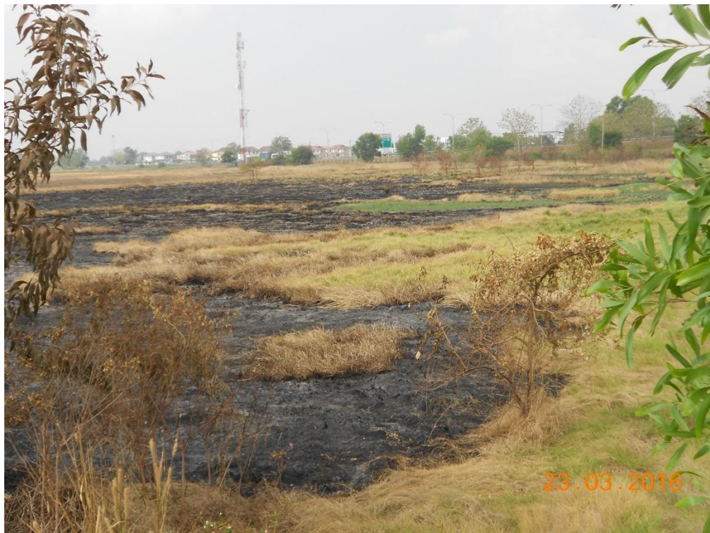
Kawasan bendang bersebelahan dengan Hospital Sultanah Bahiyah, Alor Setar