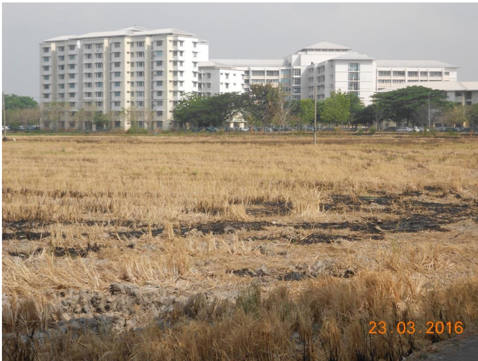
Kawasan bendang bersebelahan dengan Hospital Sultanah Bahiyah, Alor Setar (bahagian selatan hospital)