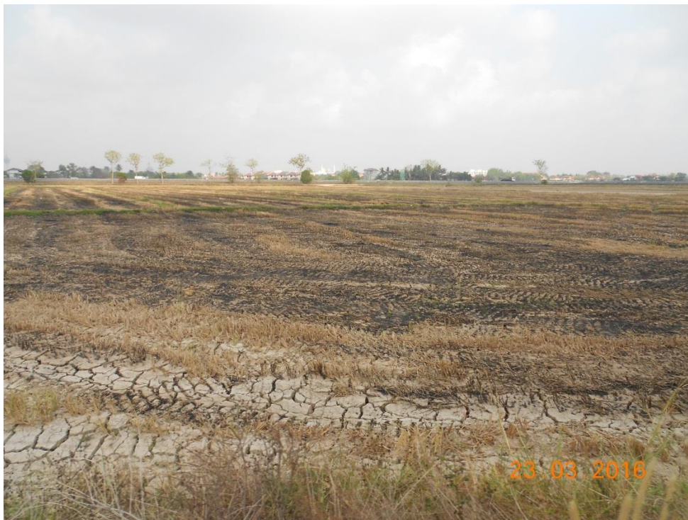
Kesan pembakaran jerami padi di kawasan selatan Hospital Sultanah Bahiyah, Alor Setar