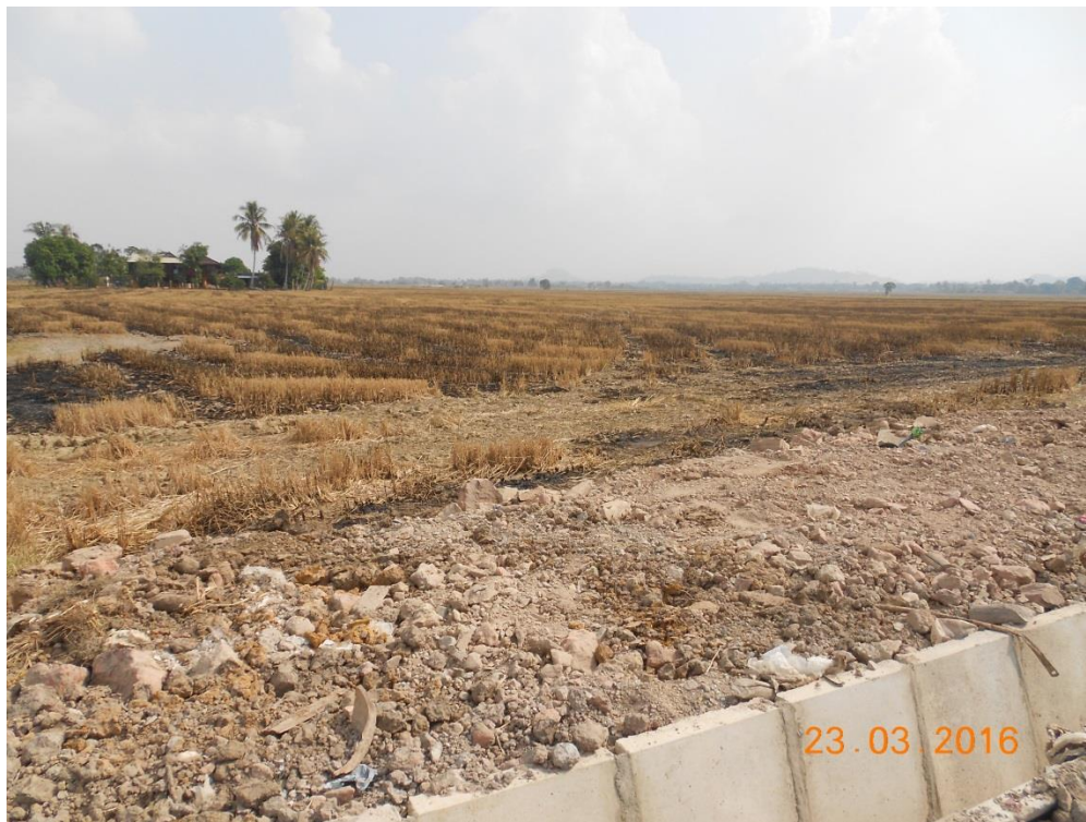
Kawasan bendang di kawasan Hutan kampung di bahagian utara Hospital Sultanah Bahiyah, Alor Setar