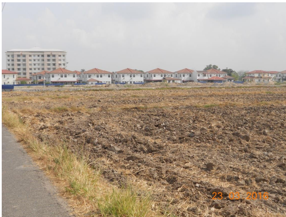
Kawasan baru perumahan berhampiran dengan Hospital Sultanah Bahiyah, Alor Setar (bahagian selatan hospital)