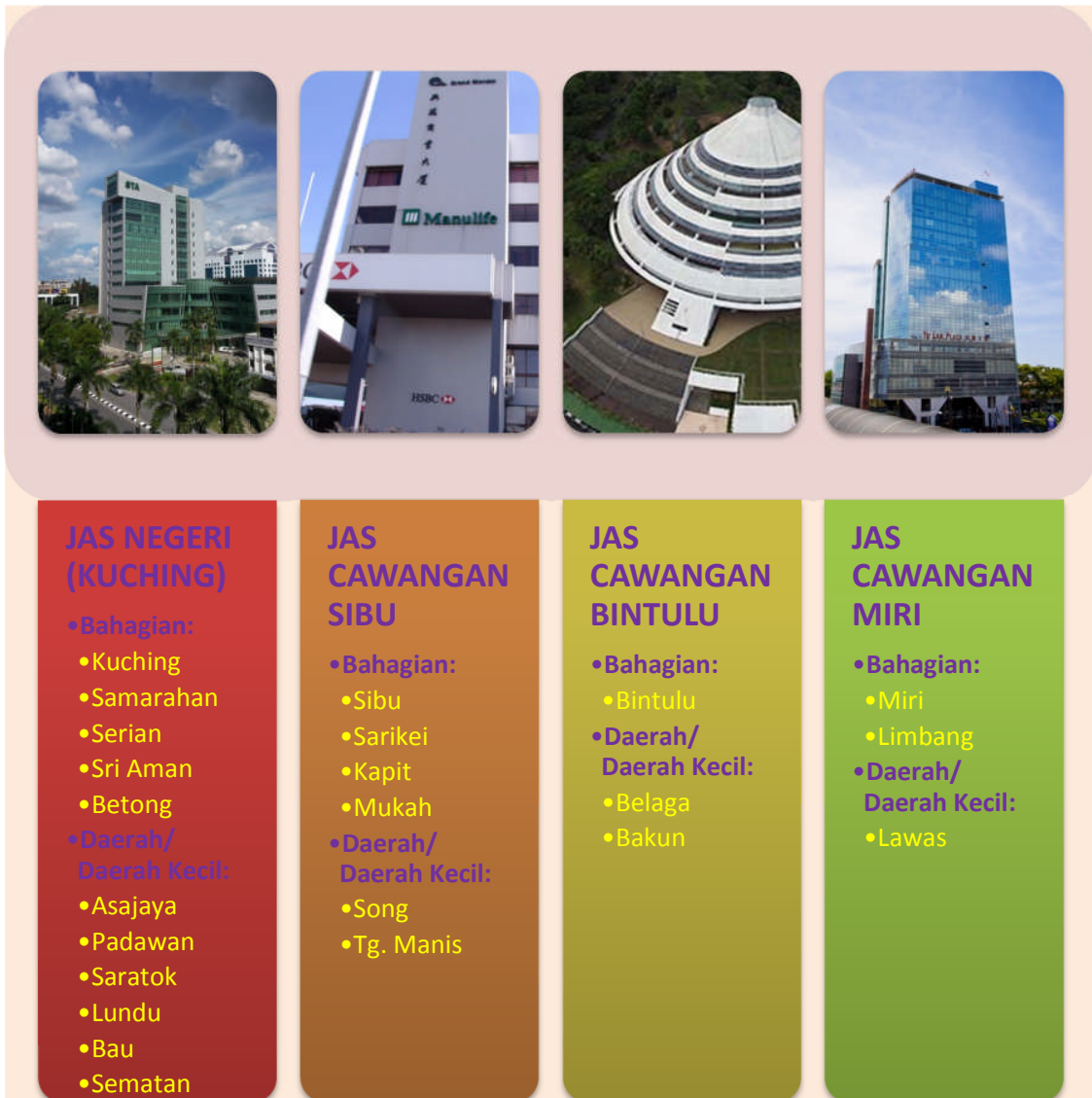
Rajah 1.0: Struktur pentadbiran JAS Negeri Sarawak