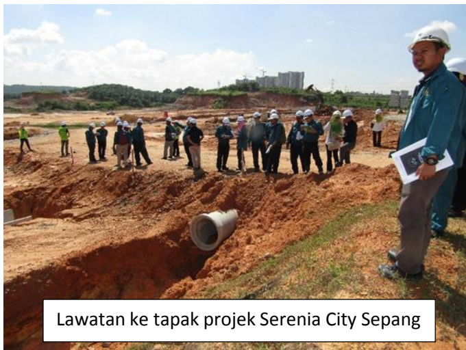
Lawatan ke tapak projek Serenia City Sepang