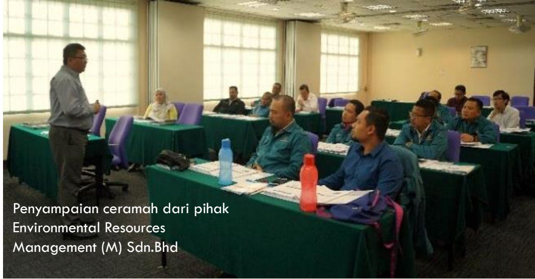
Penyampaian ceramah dari pihak Environmental Resources Management (M) Sdn.Bhd