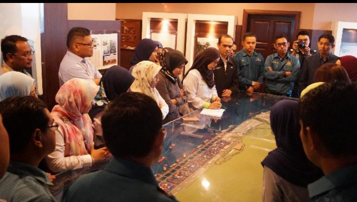
Lawatan ke Galeri Kastam