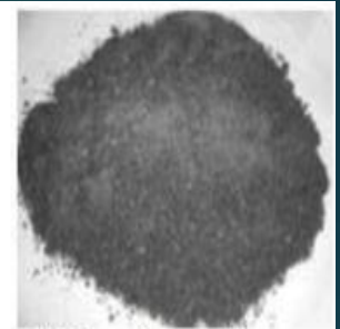
C) Ferrochrome Slag