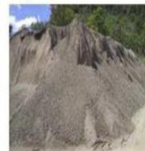
H) Steel Slag