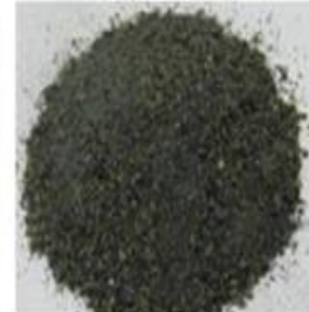
E) Bottom Ash