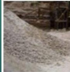
G) Imperial smelting furnace slag