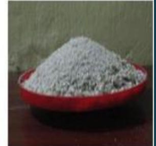
F) Blast Furnace Slag