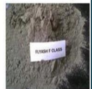
I) Fly Ash F Class