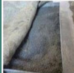
D) Palm oil clinker