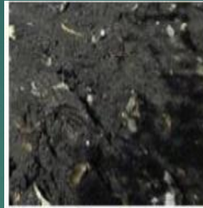
A) Waste Foundry Sand