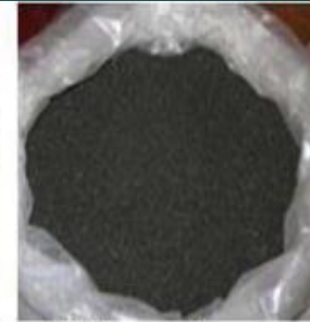
B) Copper Slag