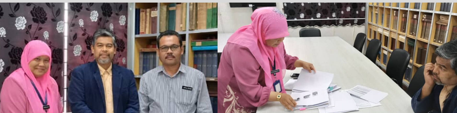
Bersama TPR negeri pada tarikh 19 Feb 2020