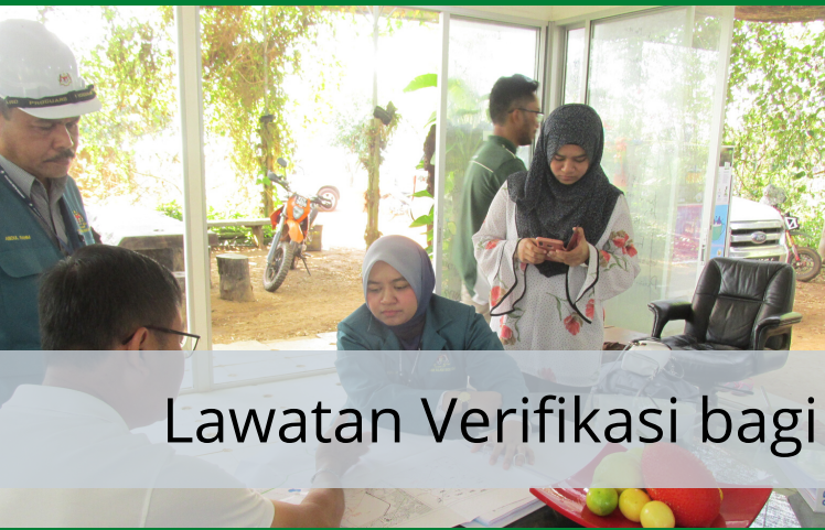
Lawatan Verifikasi bagi Projek Superfruit Valley