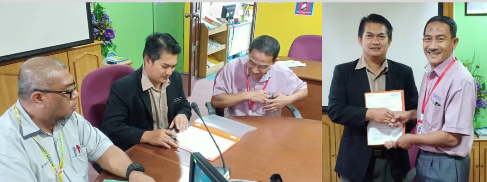
Bersama Kolej Vokasional Kangar pada tarikh 6 Mac 2020