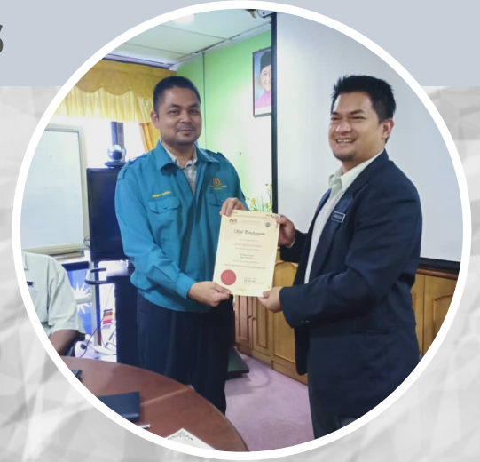
Penyampaian Sijil Ops Mawar di Johor