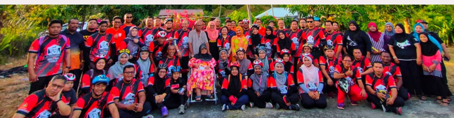
Sekitar Bukit Keteri pada 7 Januari 2020