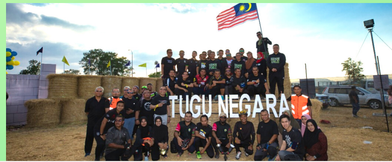
Sekitar Kampung Oran pada 27 Februari 2020