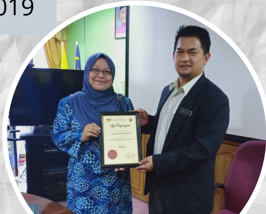
Anugerah Prestasi Cemerlang Pembayaran Bil/Tuntutan Bagi Tahun 2019