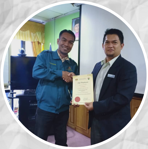
Anugerah Pencapaian CEPA Bagi Tahun 2019