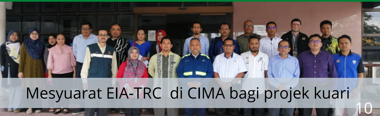
Mesyuarat EIA-TRC di CIMA bagi projek kuari