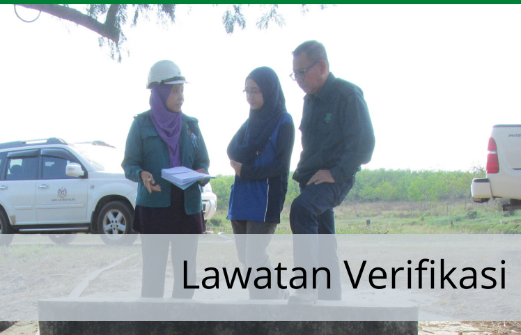
Lawatan Verifikasi EIA di MSM Perlis