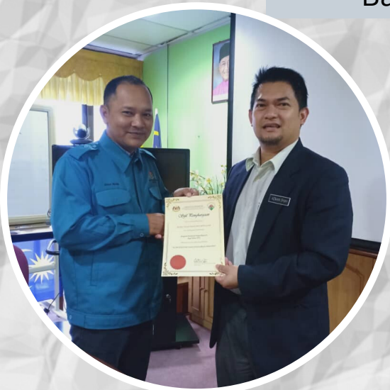
Anugerah Kreativiti Penguatkuasaan Bagi Tahun 2019