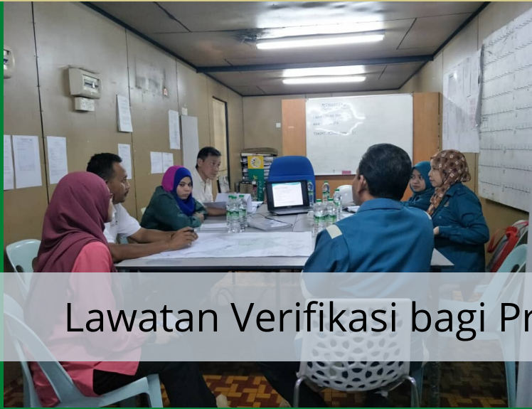
Lawatan Verifikasi bagi Projek Pembangunan di Arau