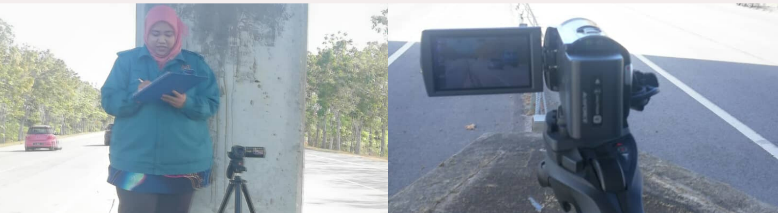
Ops Kamera di Lebuhraya Arau-Changlun