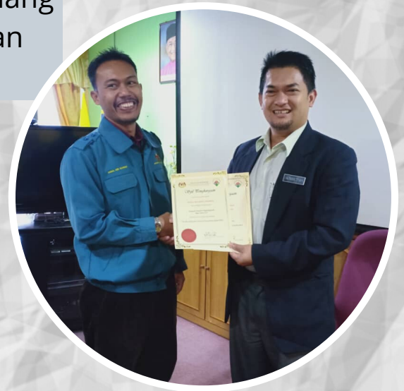
Penyampaian Sijil Ops Mawar di Johor