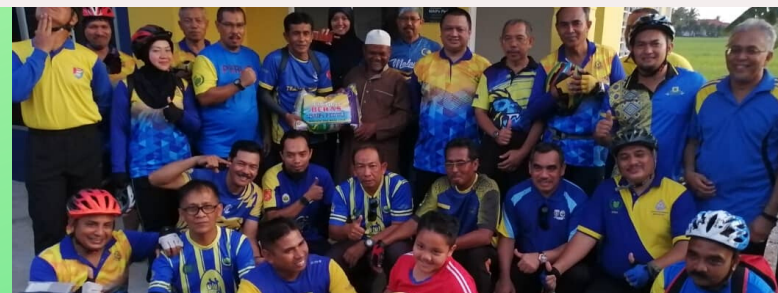
Sekitar IPK Polis Perlis pada 7 Januari 2020