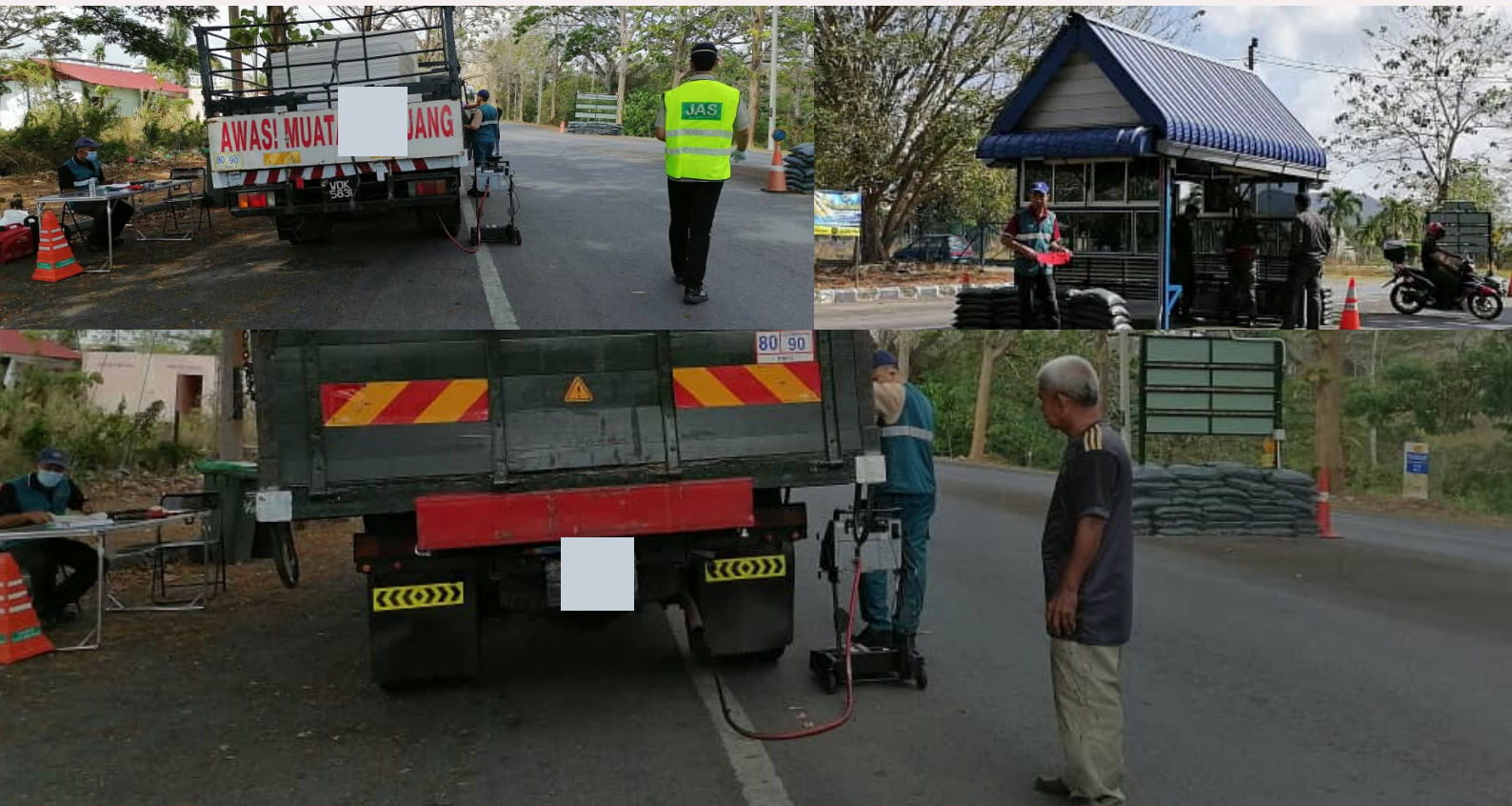
Ops Asap Hitam Kenderaan Diesel di Padang Besar