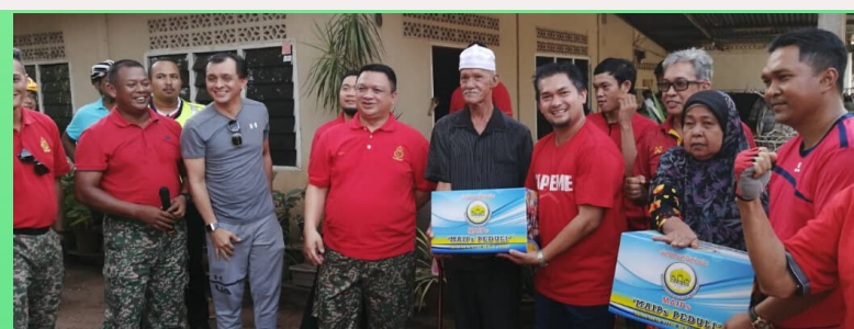
Sekitar IPK Polis Perlis di Kem Tentera RAMD pada 4 Mac 2020