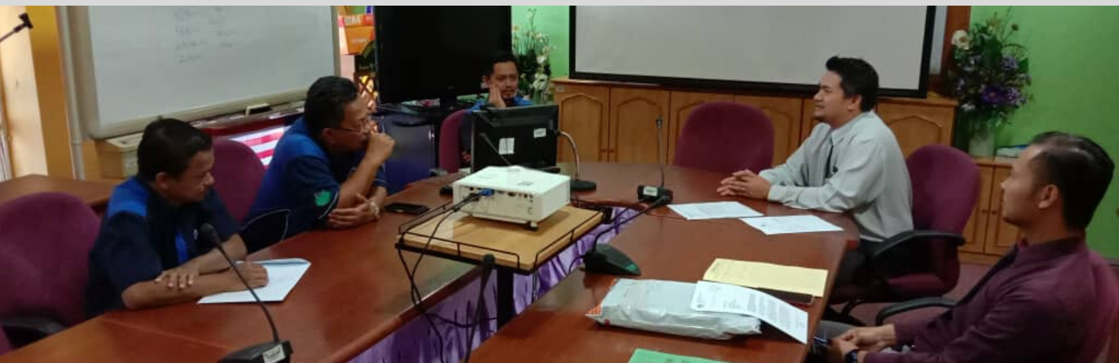
Bersama MSM Perlis pada tarikh 26 Feb 2020