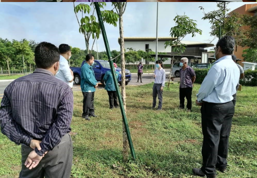
LAWATAN EIA KE TIMAH TASOH KETIKA TEMPOH PKPB PADA 14 MEI 2020