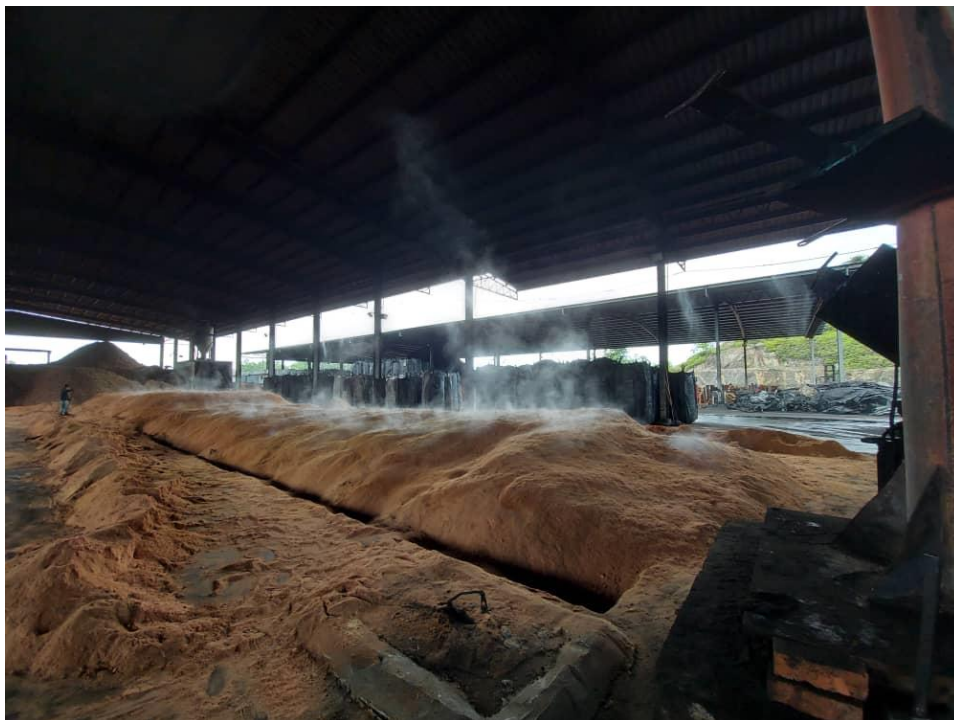
Siasatan di kilang yang disyaki melanggar Perintah Larangan.