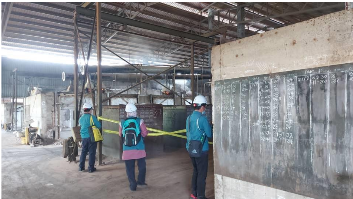
Penahanan operasi kelengkapan di bawah Seksyen 38(a) Akta Kualiti Alam Sekeliling terhadap premis yang menghasilkan pencemar udara tanpa sistem kawalan pencemaran udara (SKPU)