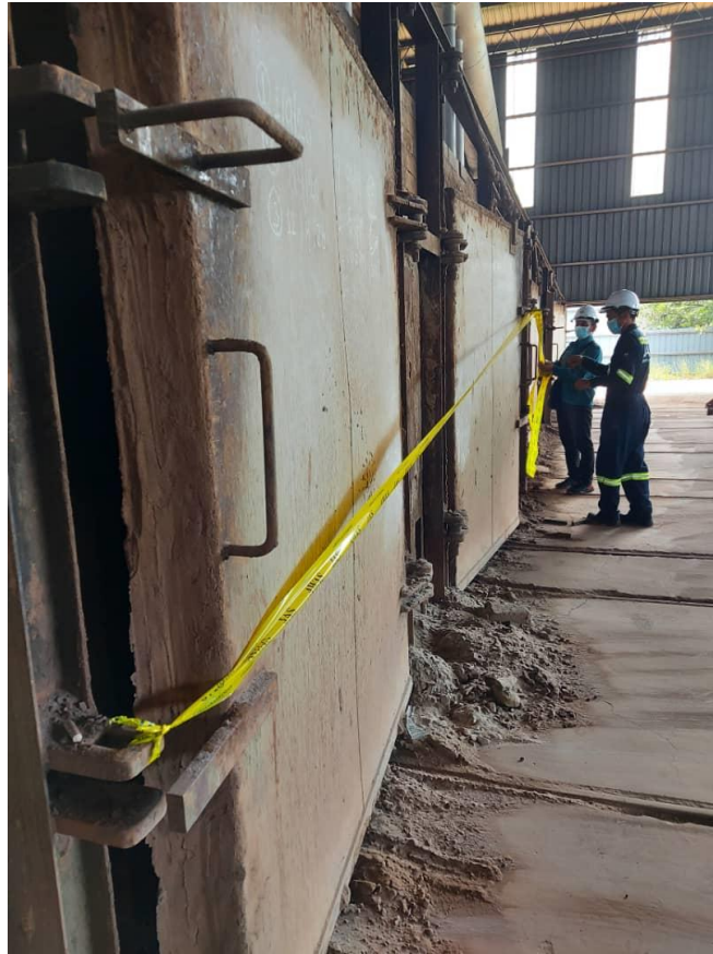
Penahanan operasi kelengkapan di bawah Seksyen 38(a) Akta Kualiti Alam Sekeliling terhadap premis yang menghasilkan pencemar udara tanpa sistem kawalan pencemaran udara (SKPU)