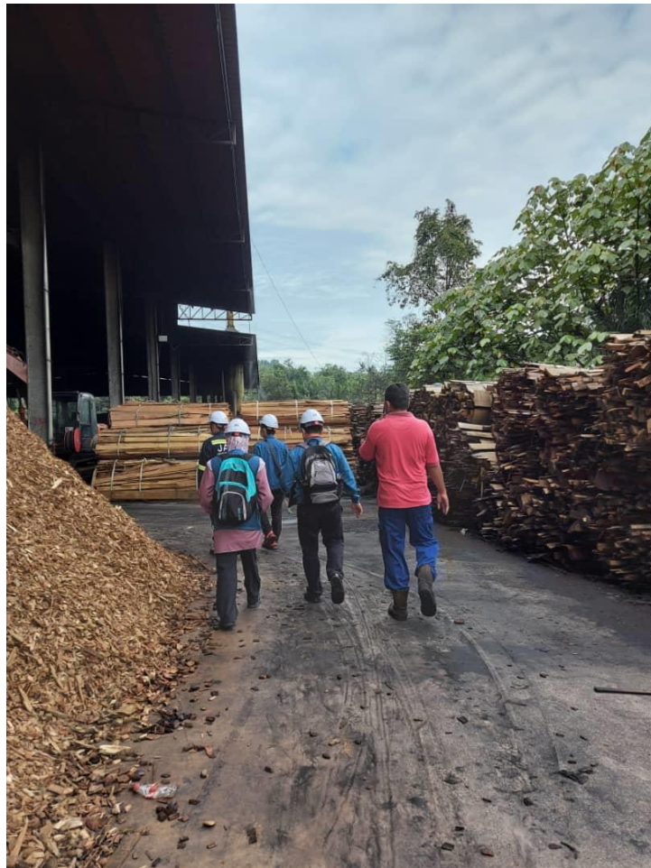
Siasatan di kilang yang disyaki melanggar Perintah Larangan.