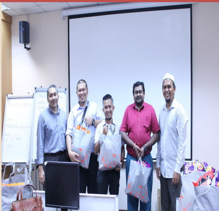
Tempat Pertama Pertandingan Fotografi