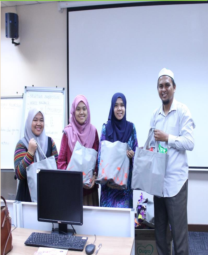
Tempat Ketiga Pertandingan Fotografi