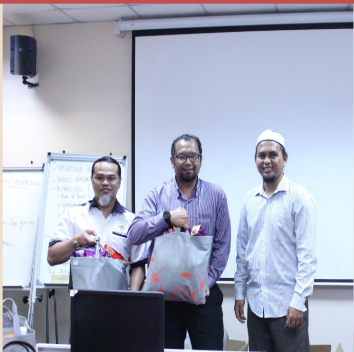
Tempat Kedua Pertandingan Fotografi