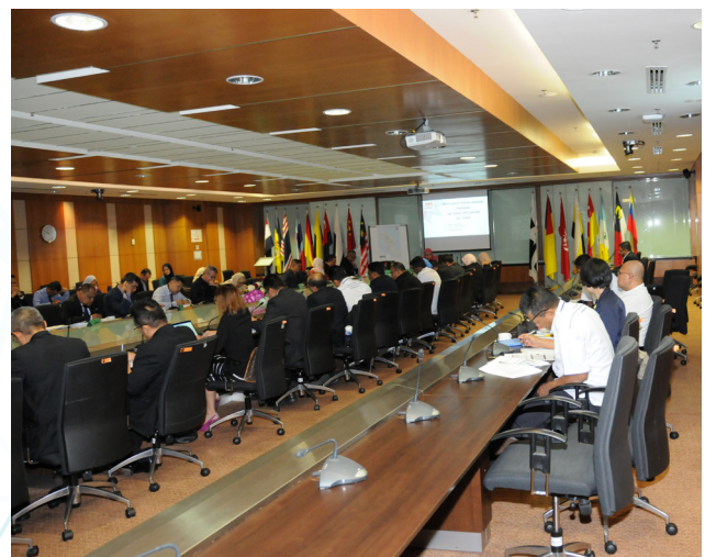
Mesyuarat JKOACP, Soal Selidik dan Bengkel