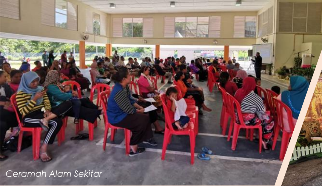
Ceramah Alam Sekitar