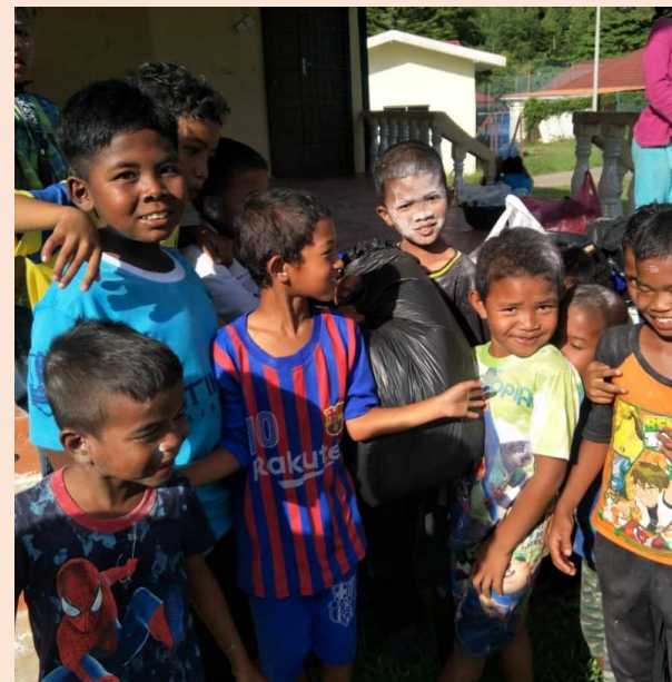
Sukaneka Bersama Komuniti