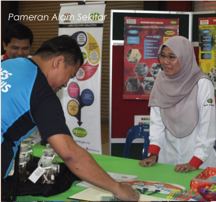
Pameran Alam Sekitar