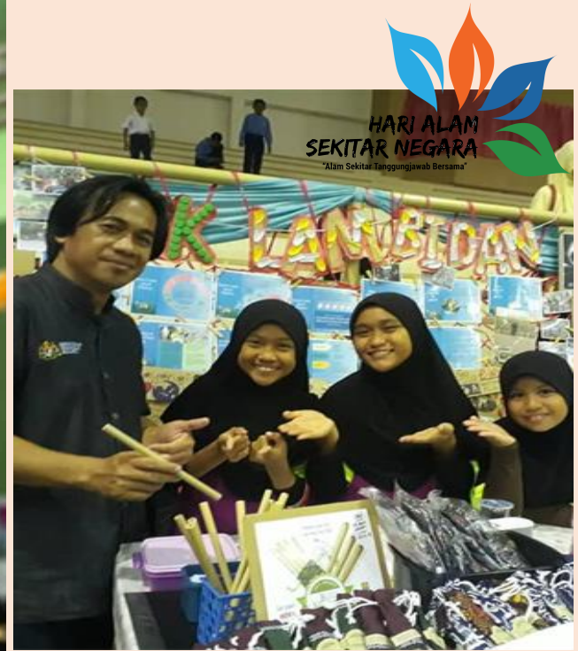
Pameran Alam Sekitar