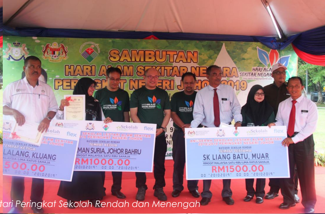
Anugerah Sekolah Lestari Peringkat Sekolah Rendah dan Menengah