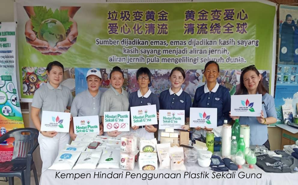
Kempen Hindari Penggunaan Plastik Sekali Guna