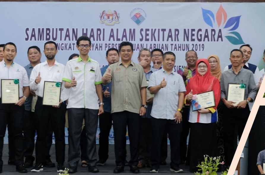
Sambutan Hari Alam Sekitar Negara Peringkat Wilayah Persekutuan Labuan Tahun 2019