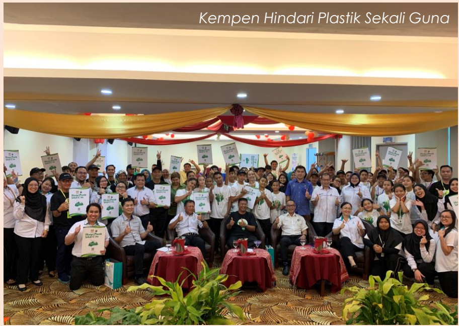
Kempen Hindari Plastik Sekali Guna