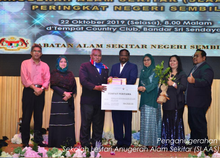
Penganugerahan Sekolah Lestari Anugerah Alam Sekitar (SLAAS)