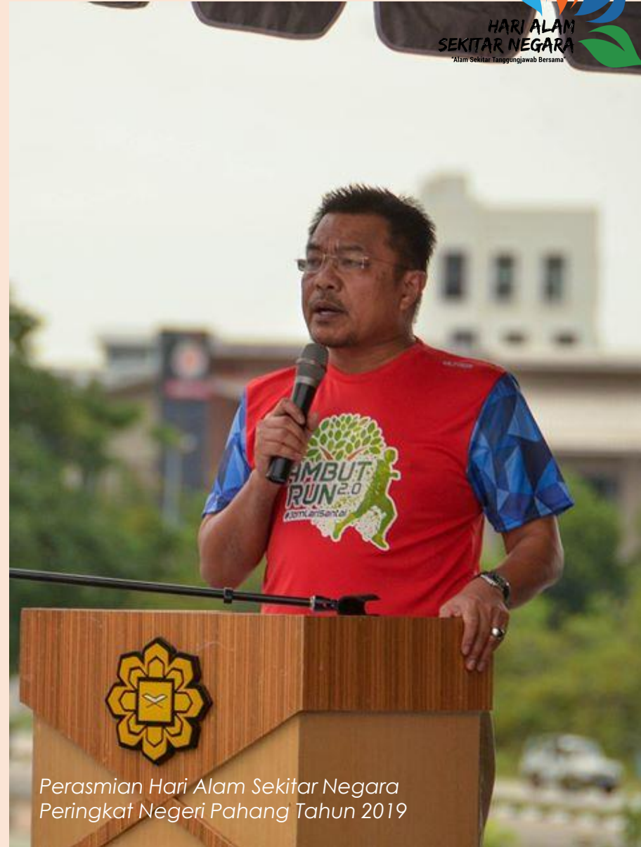
Perasmian Hari Alam Sekitar Negara Peringkat Negeri Pahang Tahun 2019