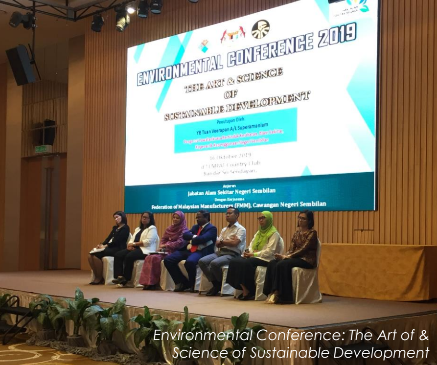
Environmental Conference: The Art of & Science of Sustainable Development