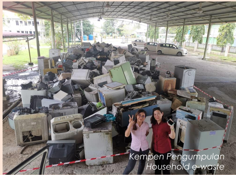
Kempen Pengumpulan Household e-waste