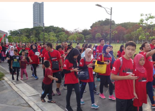
Pendaftaran Peserta dan Pelepasan Acara Eco Fun Walk