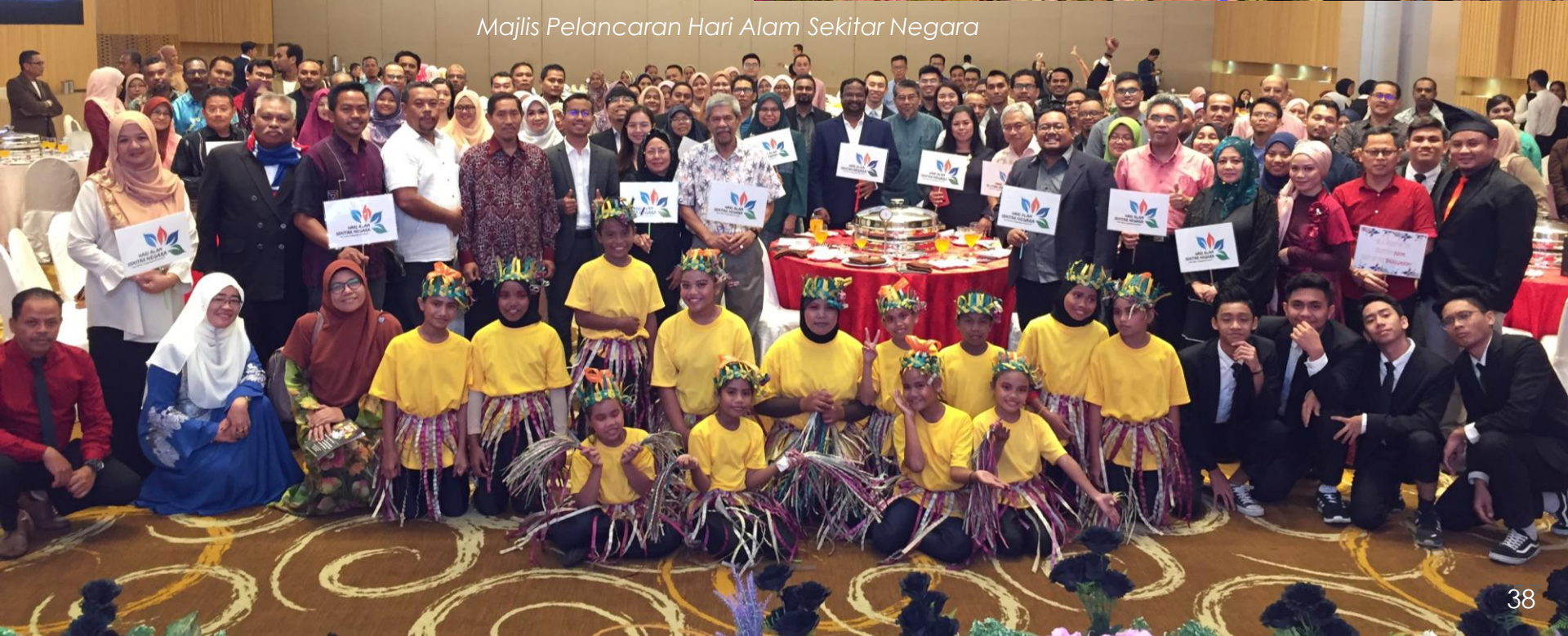
Majlis Pelancaran Hari Alam Sekitar Negara