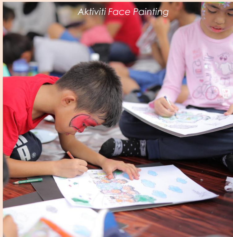
Aktiviti Face Painting