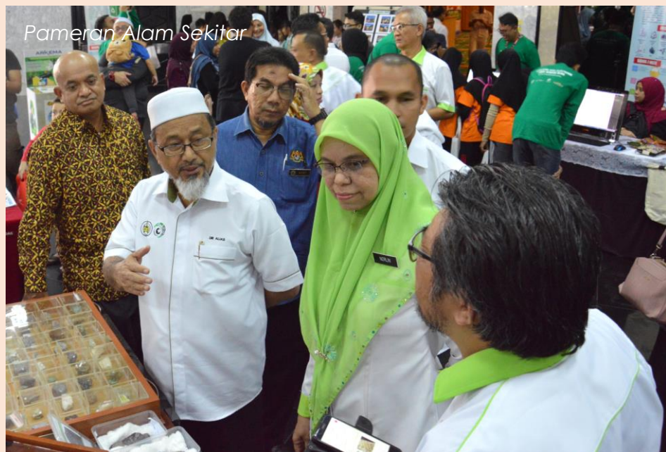
Pameran Alam Sekitar