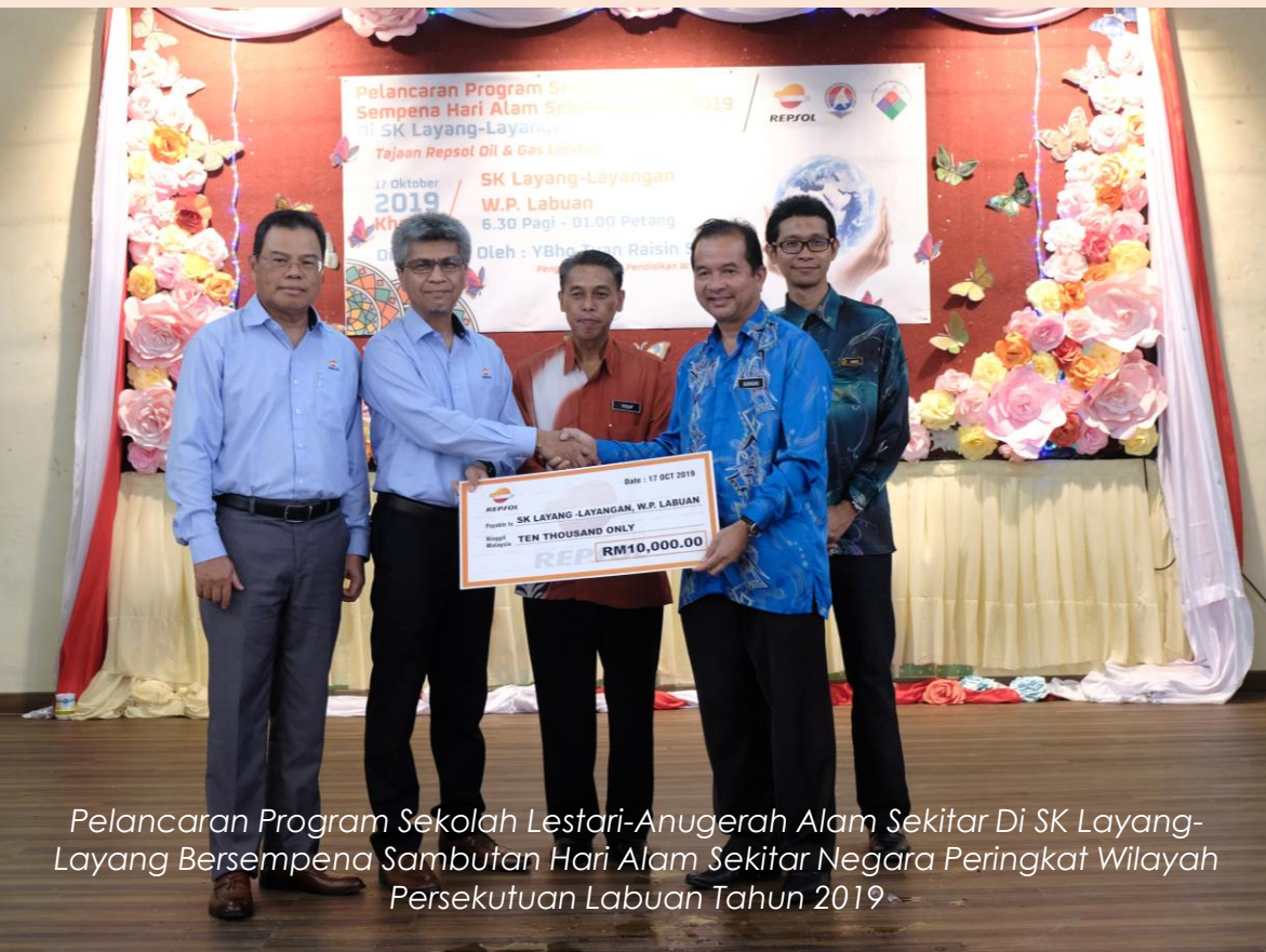
Pelancaran Program Sekolah Lestari-Anugerah Alam Sekitar Di SK Layang-Layang Bersempena Sambutan Hari Alam Sekitar Negara Peringkat Wilayah Persekutuan Labuan Tahun 2019