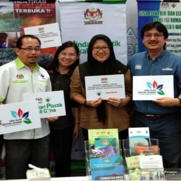
Singgah Sains Kota Belud Bersama Pusat Sains Negara