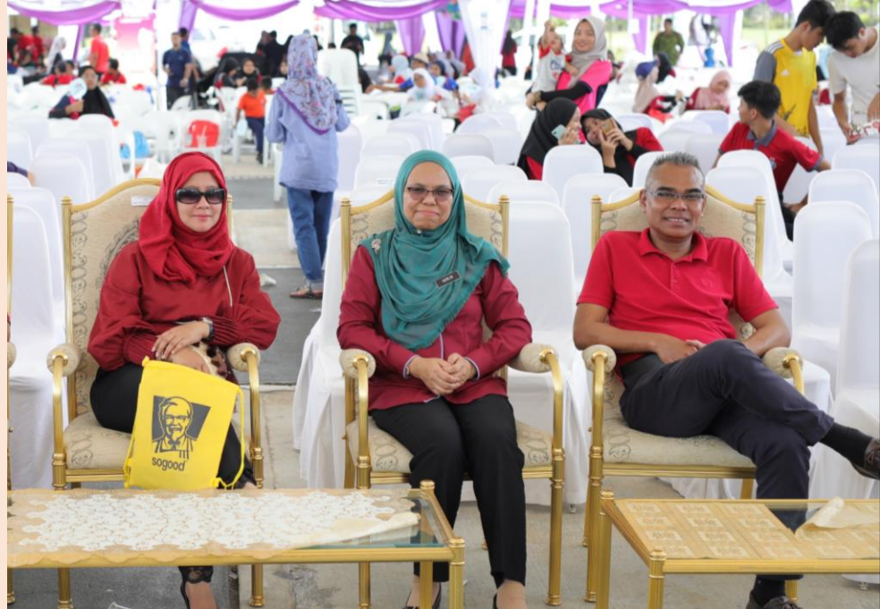
Majlis Perasmian Hari Alam Sekitar Negara Peringkat Kebangsaan Tahun 2019