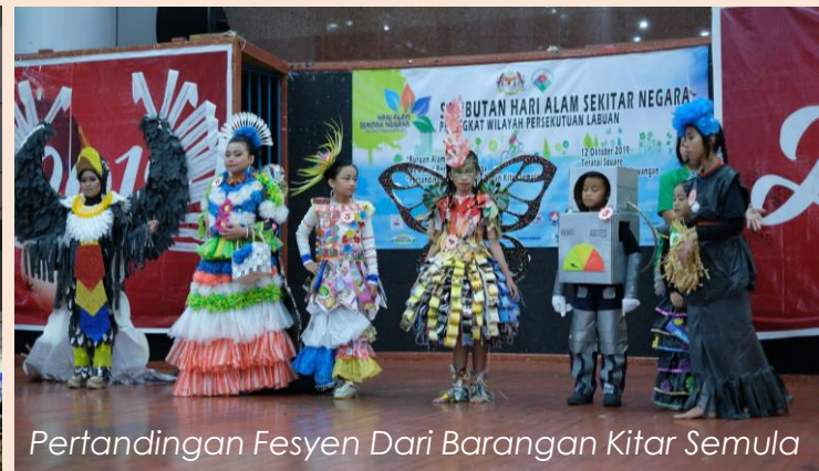
Pertandingan Fesyen Dari Barangan Kitar Semula