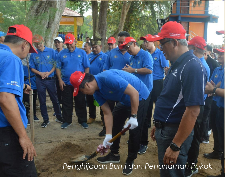
Penghijauan Bumi dan Penanaman Pokok