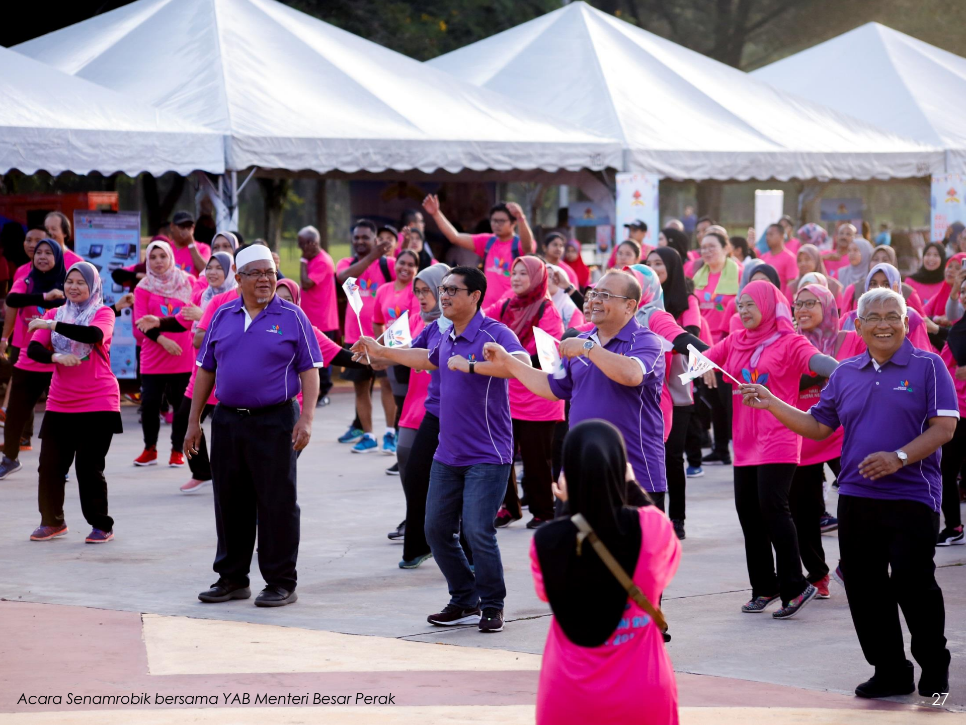
Acara Senamrobik bersama YAB Menteri Besar Perak