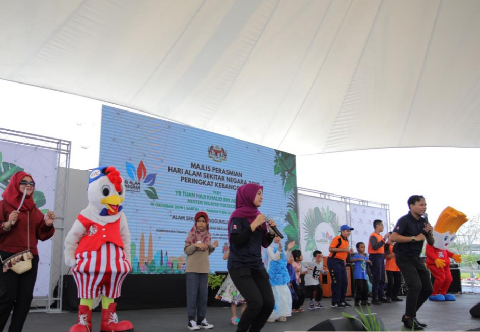
Chicken Dance Bersama KFC