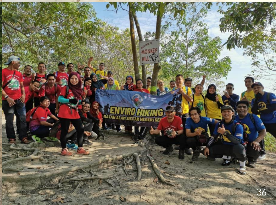
Enviro Hiking di Bukit Melati & Bukit Kepayang