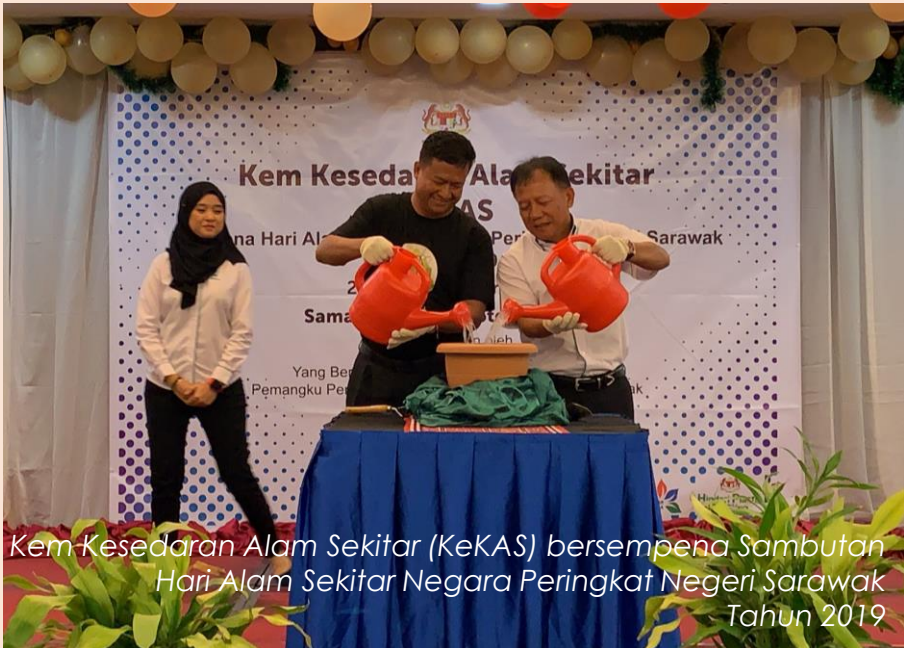
Kem Kesedaran Alam Sekitar (KeKAS) bersempena Sambutan Hari Alam Sekitar Negara Peringkat Negeri Sarawak Tahun 2019