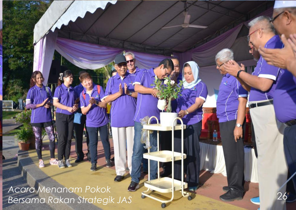
Acara Menanam Pokok Bersama Rakan Strategik JAS