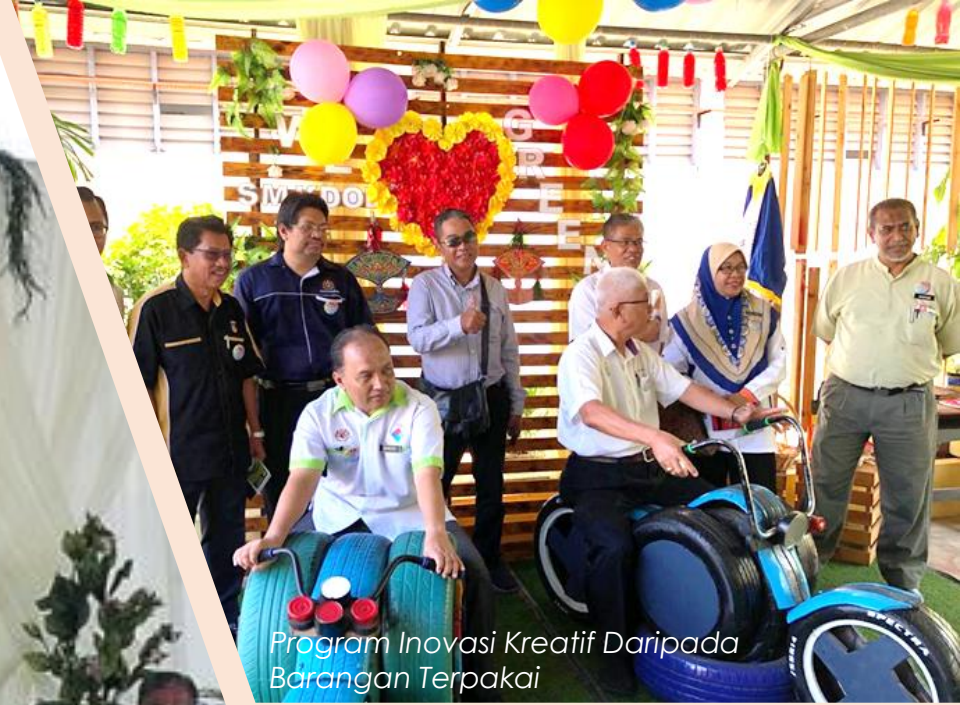
Program Inovasi Kreatif Daripada Barangan Terpakai