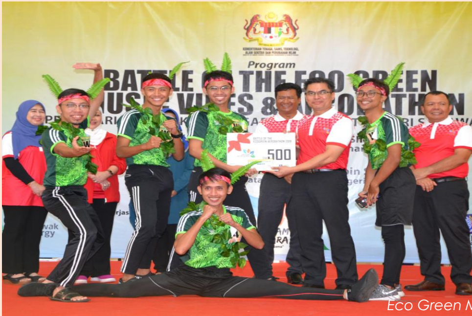
Eco Green Music Vibes