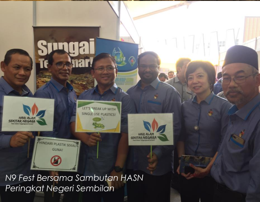
N9 Fest Bersama Sambutan HASN Peringkat Negeri Sembilan