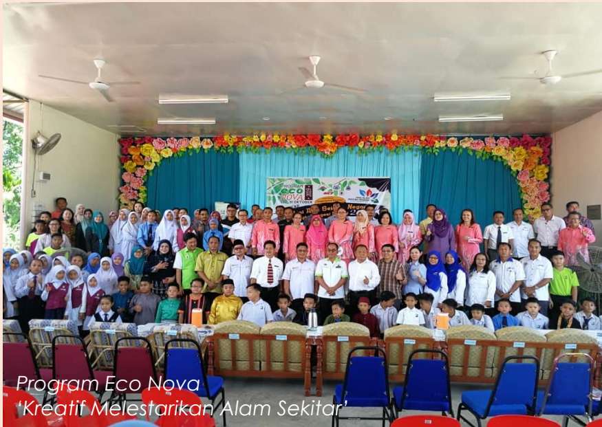
Program Eco Nova 'Kreatif Melestarikan Alam Sekitar'