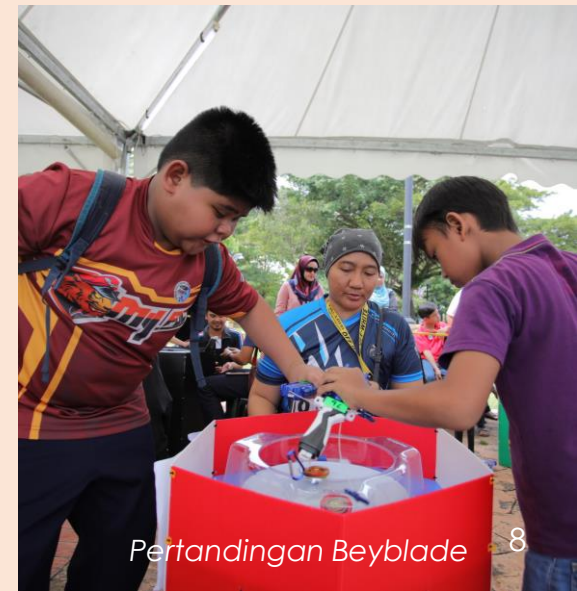
Pertandingan Beyblade 8