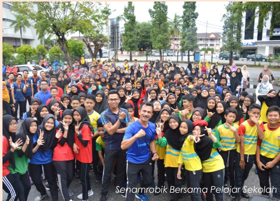
Sehamrobik Bersama Pelajar Sekolah