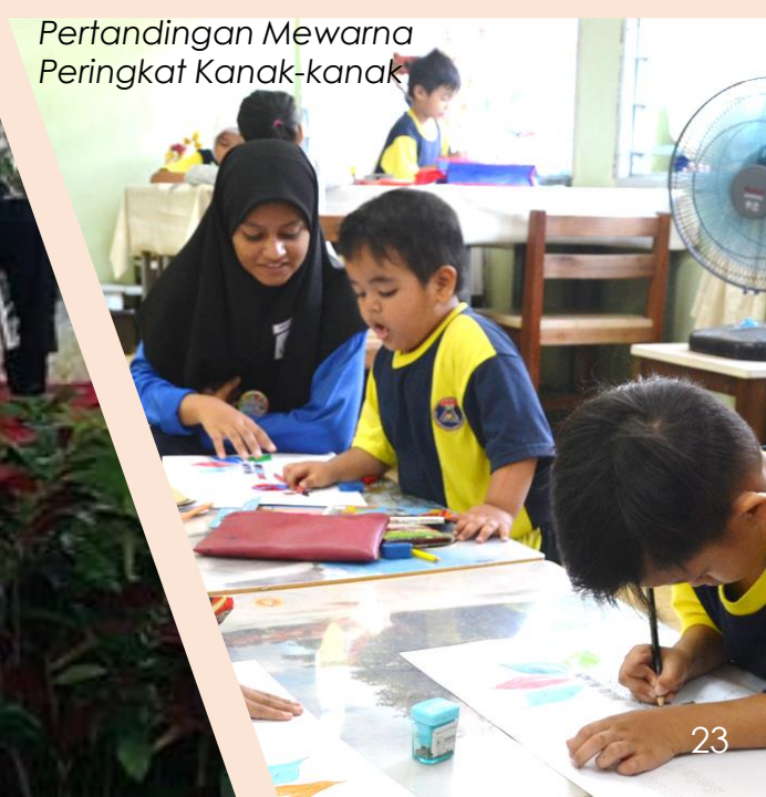
Pertandingan Mewarna Peringkat Kanak-kanak