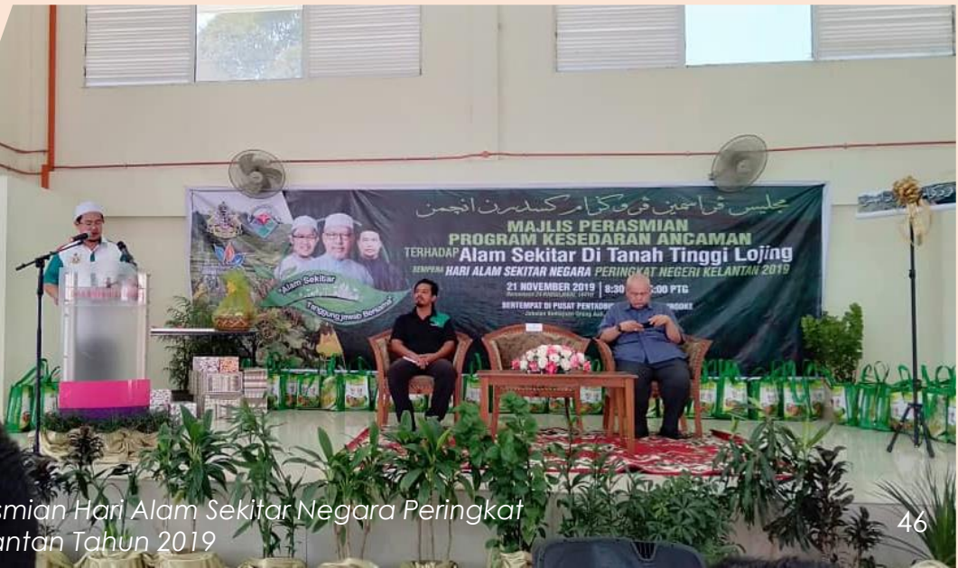
Majlis Perasmian Hari Alam Sekitar Negara Peringkat Negeri Kelantan Tahun 2019