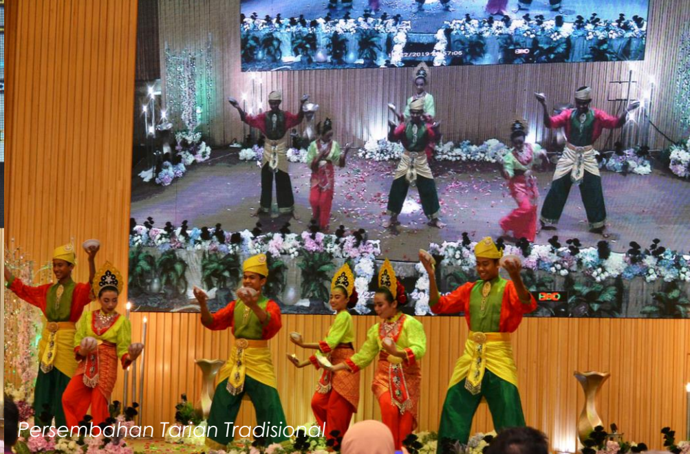
Persembahan Tarian Tradisional