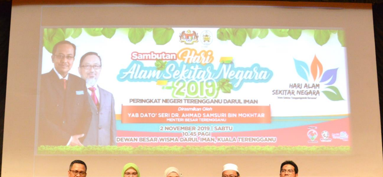
Majlis Perasmian Hari Alam Sekitar Negara Peringkat Negeri Terengganu Tahun 2019