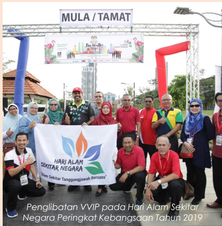
Penglibatan VVIP pada Hari Alam Sekitar Negara Peringkat Kebangsaan Tahun 2019