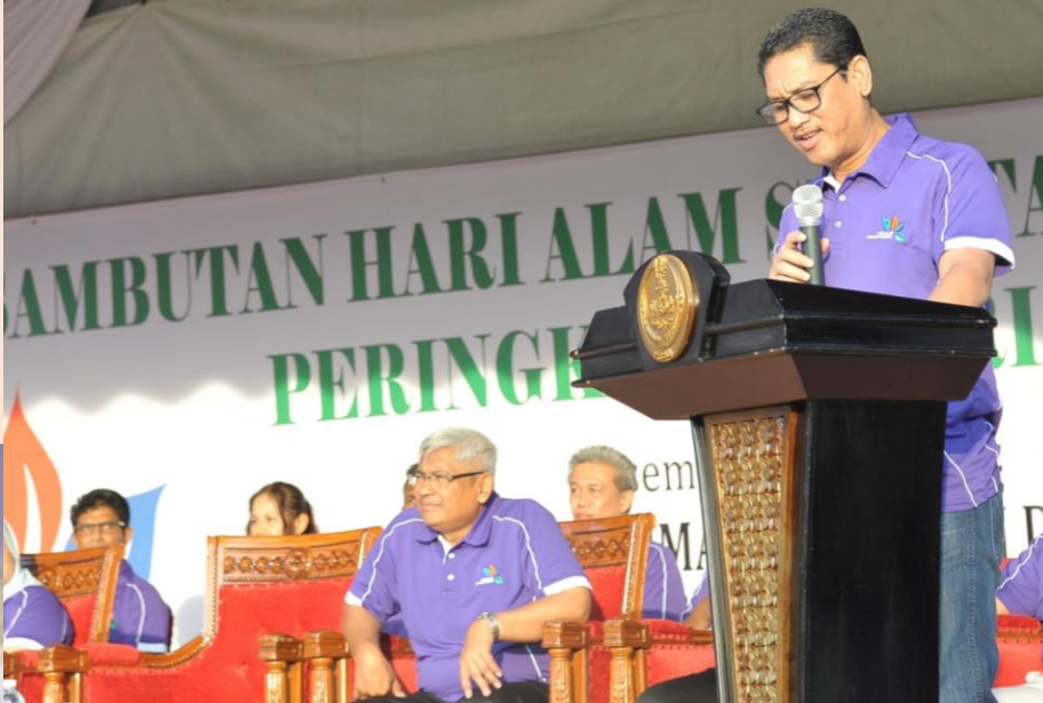
Majlis Perasmian Hari Alam Sekitar Negara Peringkat Negeri Perak Tahun 2019