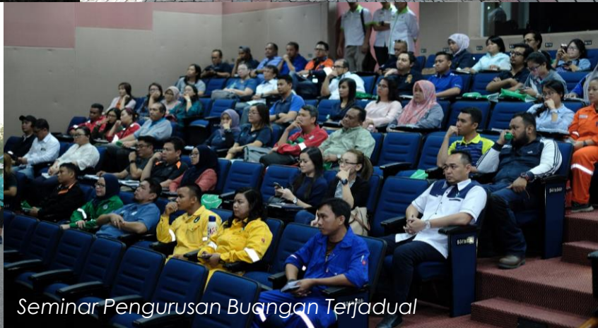
Seminar Pengurusan Buangan Terjadual