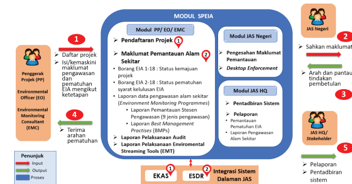
Infografik : Arkitektur Sistem SPEIA