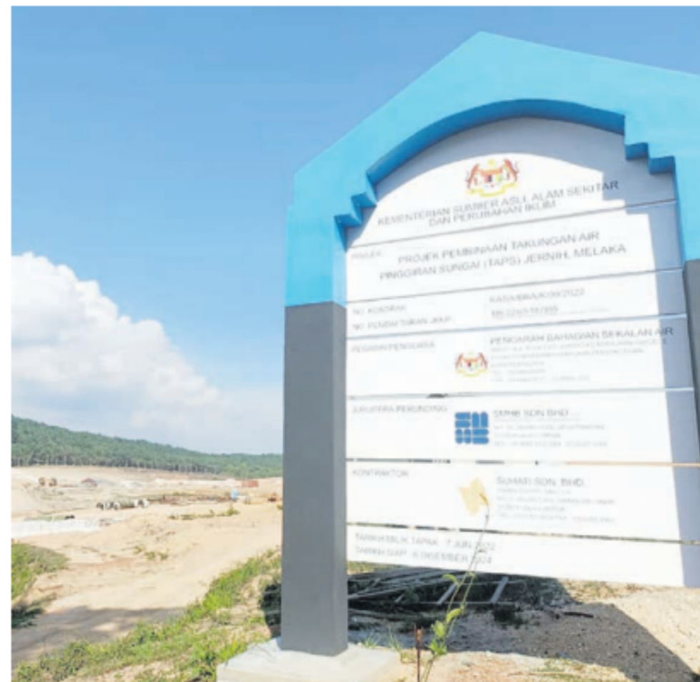
KERJA-KERJA membina TAPS Jernih yang dijangka siap pada 2026.