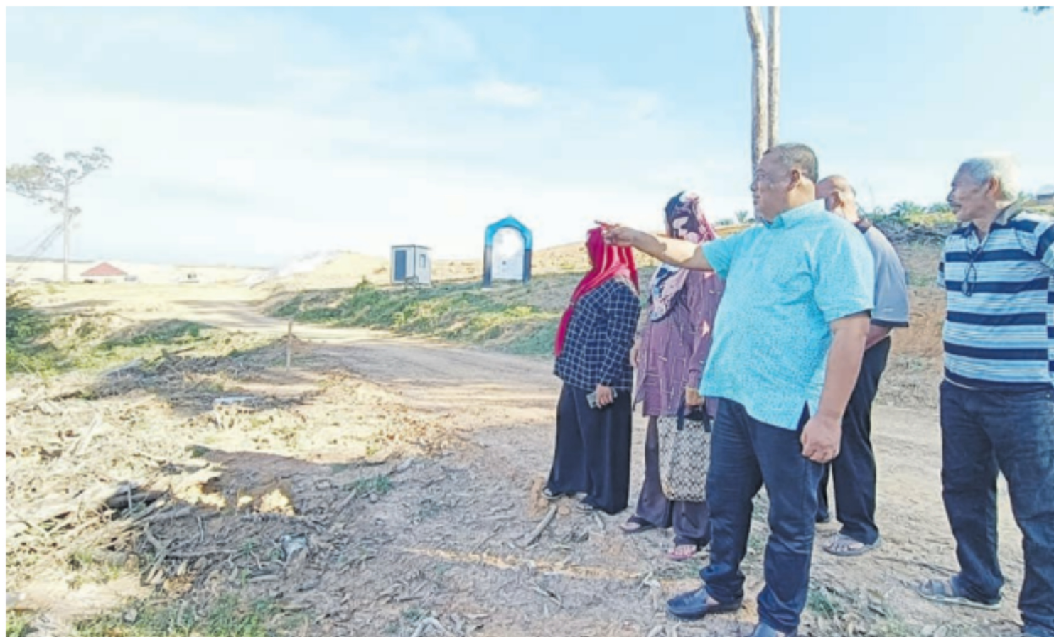
HAMEED ketika meninjau progres pembinaan TAPS Sungai Jernih.

Kapasiti itu dijangka mampu menampung keperluan pertambahan penduduk di Negeri Melaka hingga 2030, selain mengurangkan bergantung sumber air mentah dari Negeri Johor.