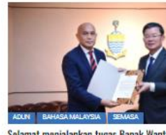
Selamat menialankan tugas Baok Wanto