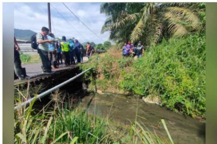
Pemeriksaan yang dibuat oleh pihak berkuasa pada Isnin.

BUKIT MERTA JAM - Pencemaran Sungai Kulim dan Sungai Air Merah, Kedah akibat pelepasan sisa ternakan di perkampungan Sungai Lembu, di sini tidak memberi kesan secara langsung kepada penduduk di sekitar.