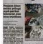
Keratan akhbar BH semalam.

ran dari aspek perlombongan itu dan syarikat yang sumber kewangannya yang kukuh disebabkan ini memerlukan perbelanjaan yang besar," katanya selepas menghadiri Program MESRA Hari Bertemu Pelanggan Kera-