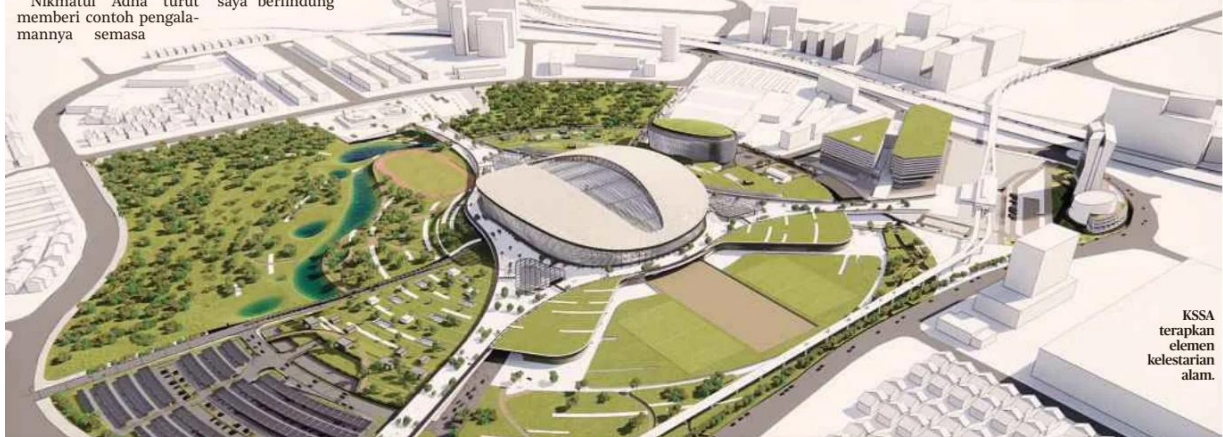
KSSA terapkan elemen kelestarian alam.

"Selain itu, pembangunan KSSA mengambil kira aspek persekitaran hijau yang memberi manfaat kepada penduduk dan tentunya diputuskan sebelum dimulakan," katanya.