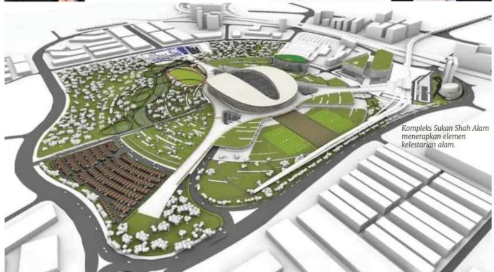
Kompleks Sukan Shah Alam menerapkan elemen kelestarian alam.