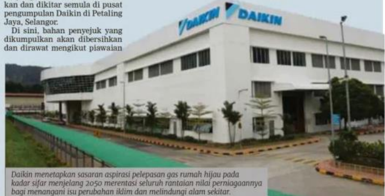
Daikin menetapkan sasaran aspirasi pelepasan gas rumah hijau pada kadar sifar menjelang 2050 merentasi seluruh rantaian nilai perniagaannya bagi menangani isu perubahan iklim dan melindungi alam sekitar.

Dengan memperkenalkan inisiatif ini, Daikin Malaysia komited untuk menerajui industri melalui tanggungjawab sosial korporat (CSR) untuk menjadi teladan dalam penjagaan alam sekitar.