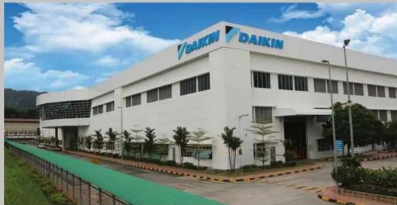
DAIKIN menetapkan sasaran aspirasi pelepasan gas rumah hijau pada kadar sifar menjelang 2050 merentasi seluruh rantaian nilai perniagaannya bagi menangani isu perubahan iklim dan melindungi alam sekitar.

Tekad memenuhi permintaan global untuk persekitaran udara yang bersih dan selesa dalam sektor penyediaan perkhidmatan solusi pengudaraan, Daikin turut berinovasi dalam mengutamakan pemeliharaan dan pe-