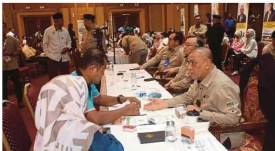
Saarani mendengar laporan orang ramai ketika hadir pada Program MESRA Hari Bertemu Pelanggan Kerajaan Negeri Perak 2024 Siri 5, di Ipoh, kelmarin.

"Jadi syarikat berkaitan mestilah syarikat yang ada kepaka-