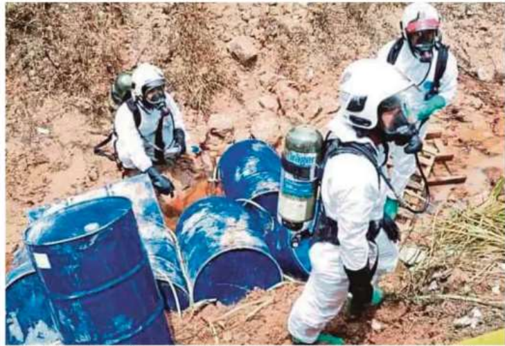
Anggota HAZMAT menjalankan operasi pemindahan lapan tong disyaki mengandungi bahan kimia yang dibuang ke dalam parit di Kampung Desa Aman, Sungai Buloh.

Selain JBPM dan JAS, turut terlibat dalam operasi itu ialah Majlis Bandaraya Shah Alam (MBSA), Pejabat Tanah, Suruhanjaya Perkhidmatan Air Negara (SPAN) dan Polis Diraja Malaysia (PDRM).