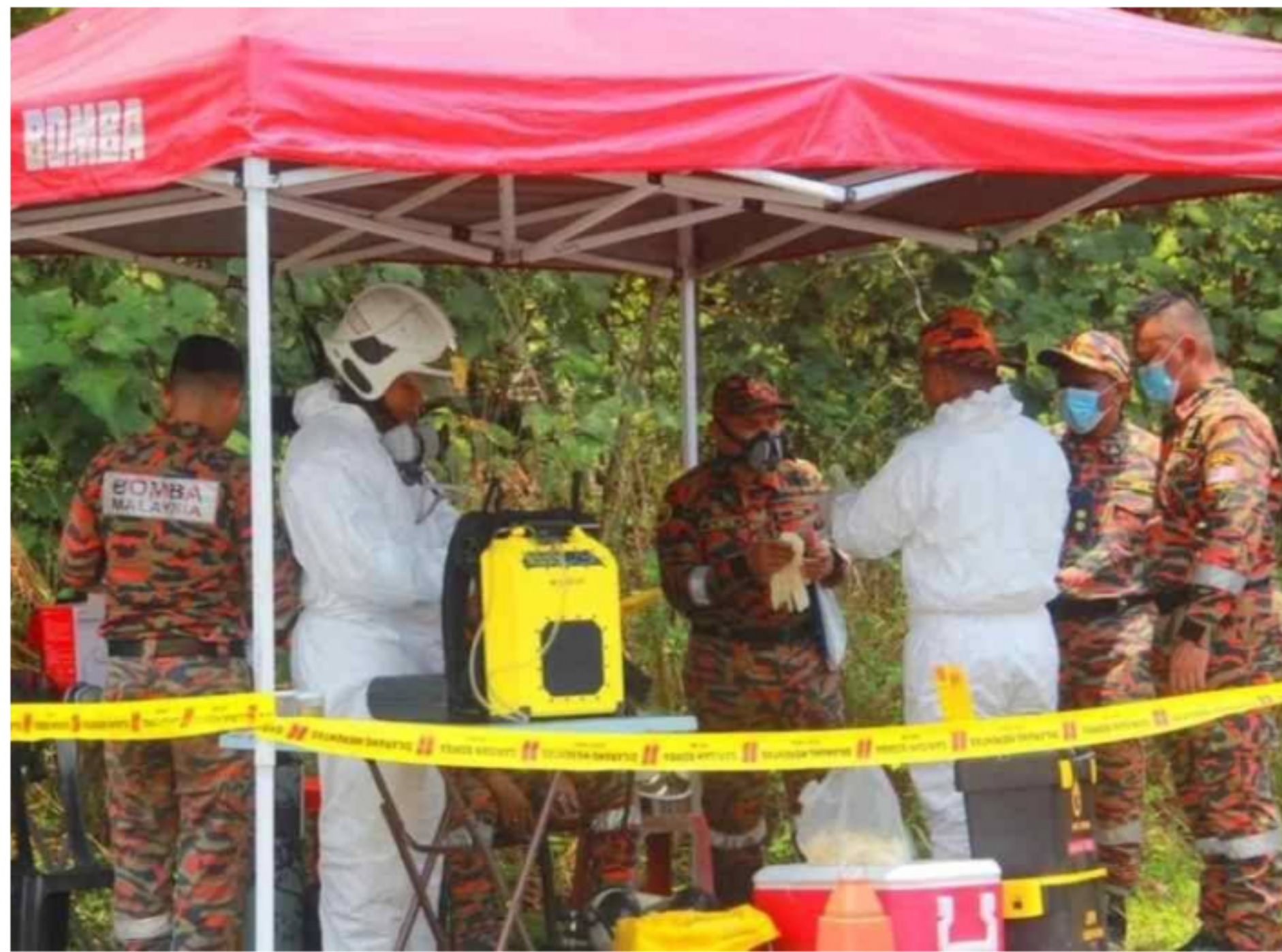
Pasukan HAZMAT Bomba turut ke lokasi bagi menjalankan siasatan serta pengujian in-situ di sekitar tempat kejadian.

Jawatankuasa itu berkata, persampelan terhadap buangan di kawasan tersebut telah dijalankan dan sampel yang diambil dihantar ke Jabatan Kimia.