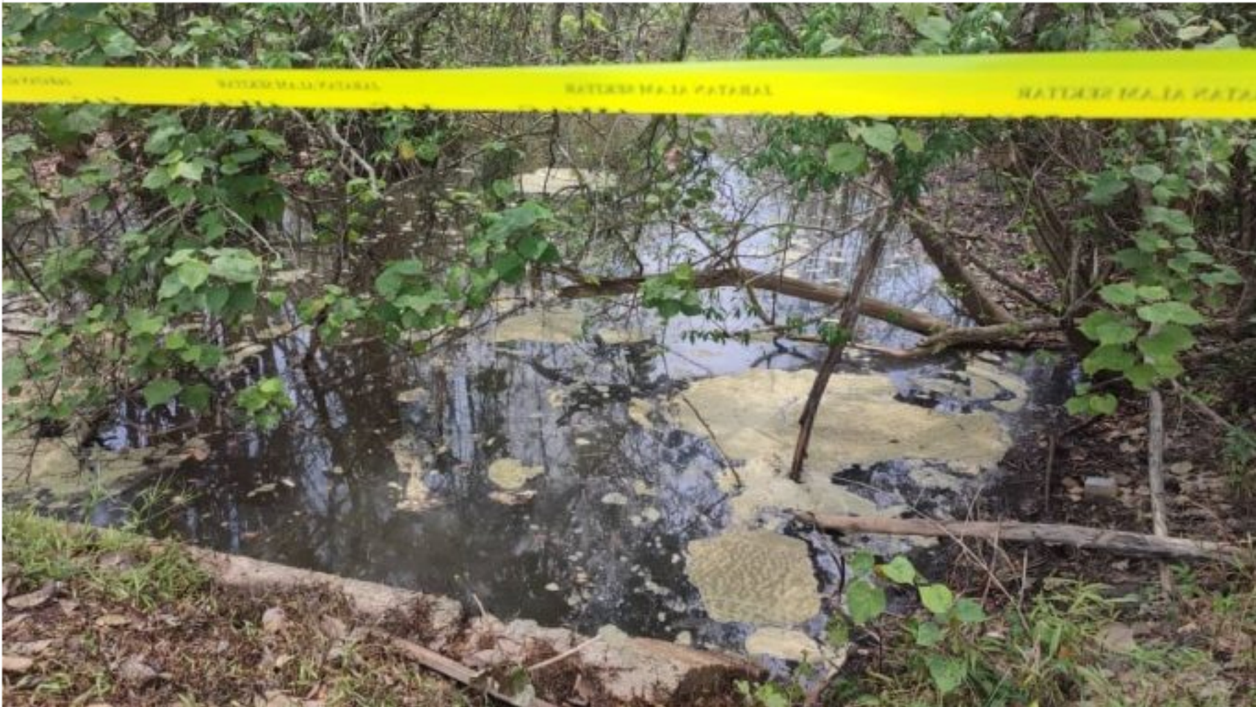
Gambar pencemaran Sungai Teritip yang tercemar

Oleh Zazrina Zainuddin - 2 September 2024