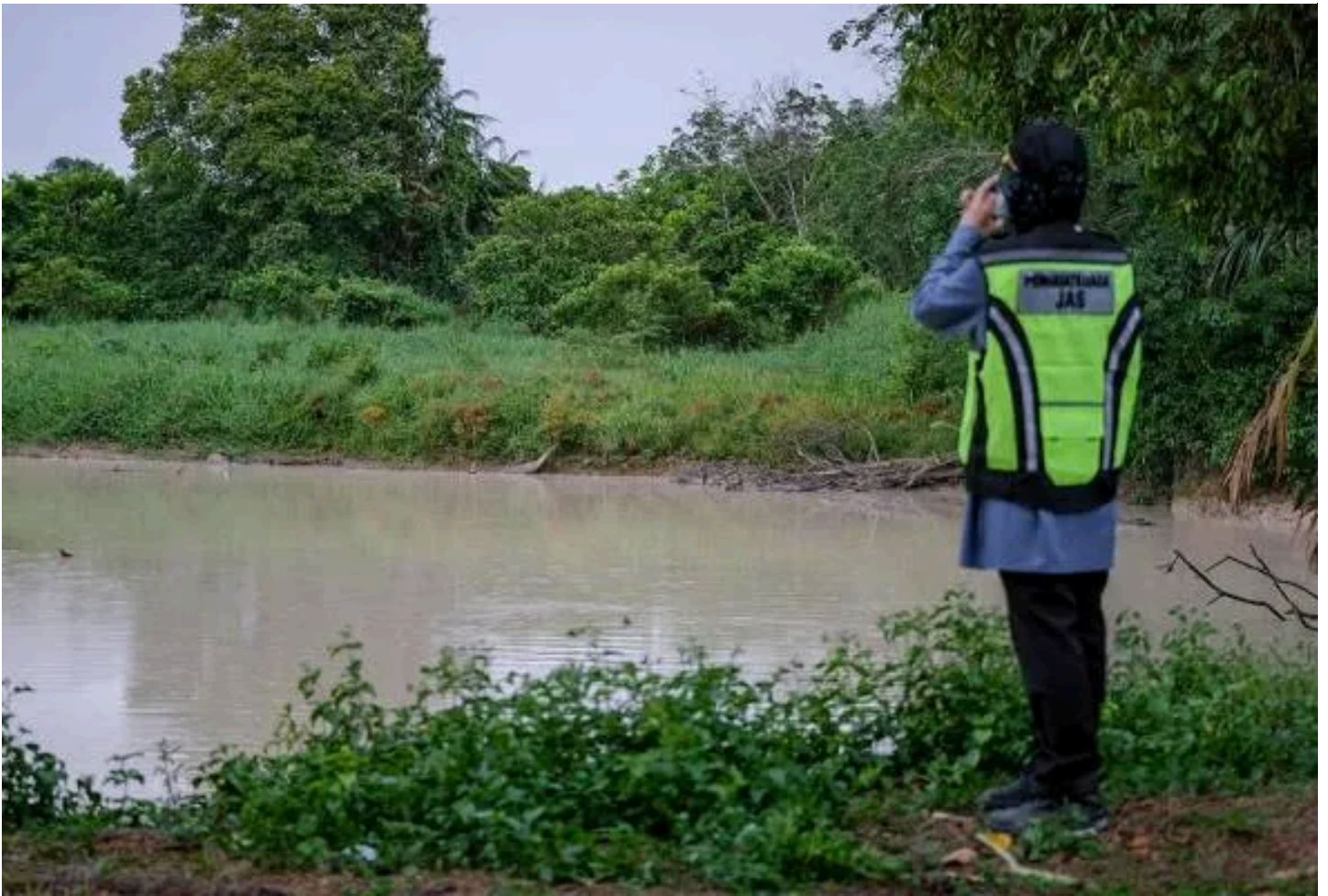
Keadaan Sungai Sayong di Ulu Sungai Johor, Kota Tinggi, masih berlumpur walaupun telah memasuki hari kedua, hari ini.

JOHOR BAHRU: Sebuah syarikat yang dikaitkan dengan insiden pencemaran Sungai Johor berkemungkinan berdepan tindakan pendakwaan sekiranya Jabatan Alam Sekitar (JAS) mengenal pasti terdapat pelanggaran di bawah Akta Kualiti Alam Sekeliling 1974 (Akta 127).