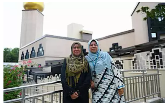
Masjid Darul Makmur ruang tabur bakti, timba ilmu, Berita Singapura -...