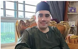
Pegawai HDB meninggal dunia setelah sertai lumba bot naga , Berita Singapur...