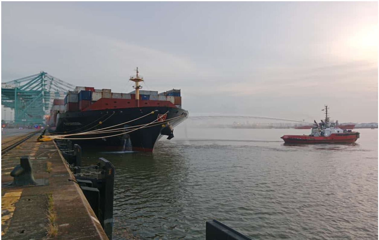
Gambar 2 & 3: Kerja pemadaman kebakaran kontena di atas Kapal MV Kyparissia.