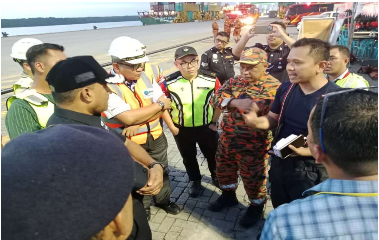
Gambar 4 & 5: Taklimat dan perbincangan antara agensi yang terlibat di Pos Kawalan Hadapan (PKH).