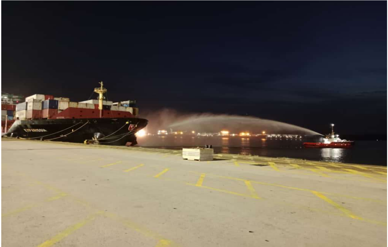
Gambar 6: Operasi pemadaman masih giat dijalankan sehingga waktu malam.