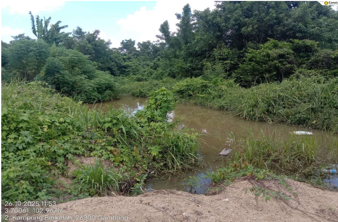
Gambar 11: Alur air di bahagian hulu (upstream) kawasan stesen timbang dalam keadaan normal