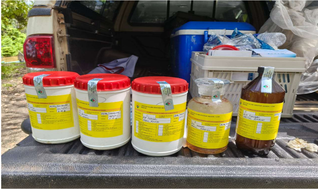
Gambar 5: Sampel air sungai di lokasi ikan mati untuk di analisis oleh Jabatan Kimia Malaysia