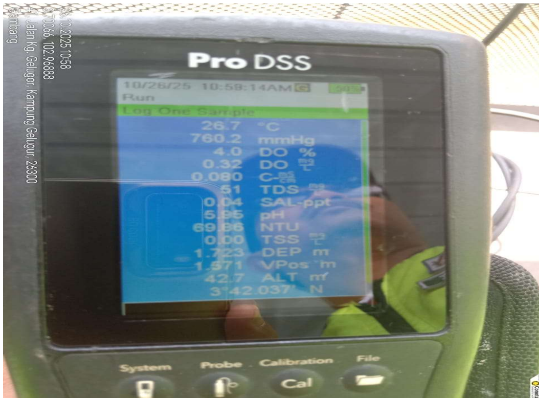
Gambar 3 & 4: Ujian in-situ di kawasan sangkar ikan pengadu