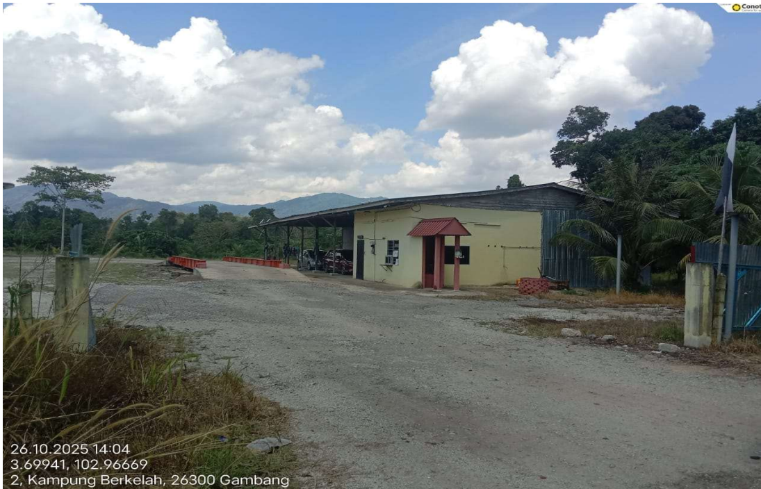
Gambar 6: Stesen timbang sawit syarikat Soon Huat Gambang Sdn. Bhd