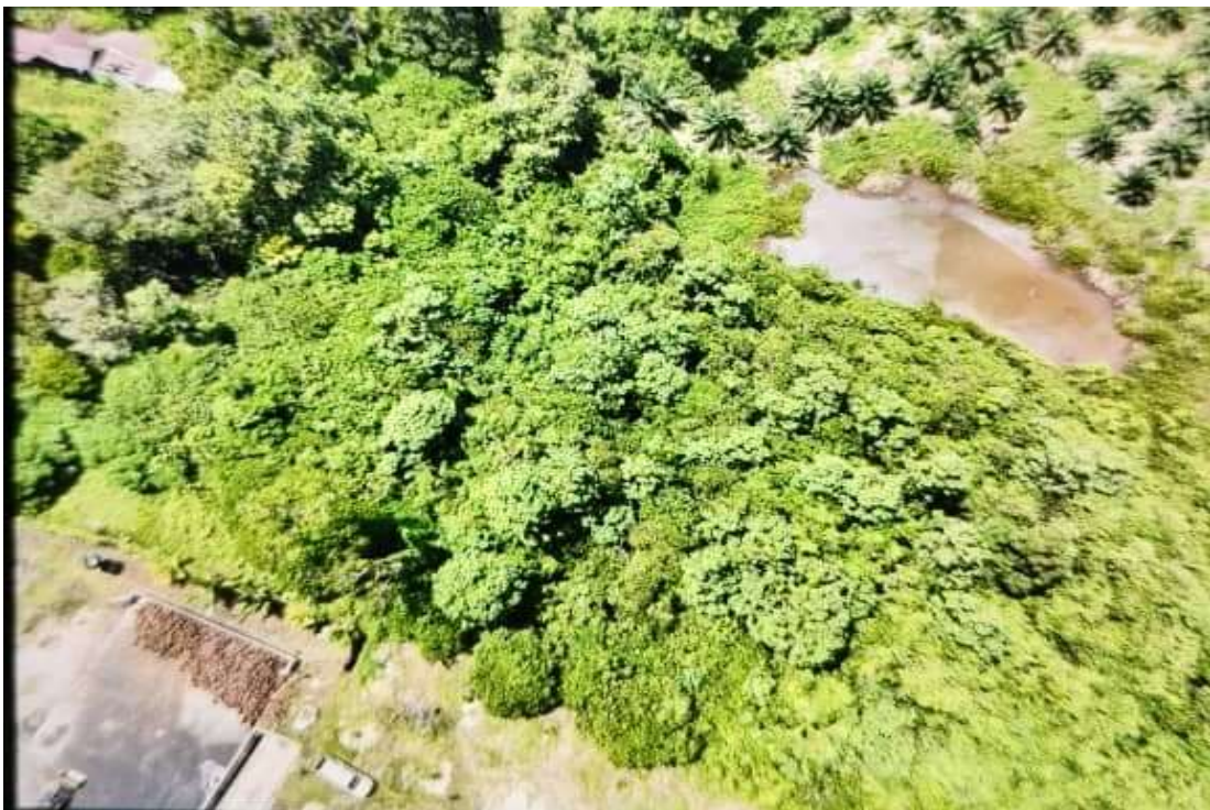
Gambar 9 & 10: Gambar kawasan stesen timbang yang di rakam melalui udara