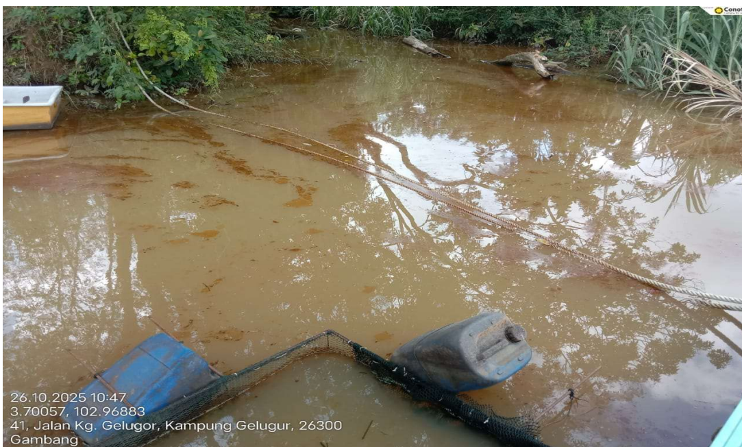
Gambar 2: Terdapat tompokan minyak di lokasi aduan