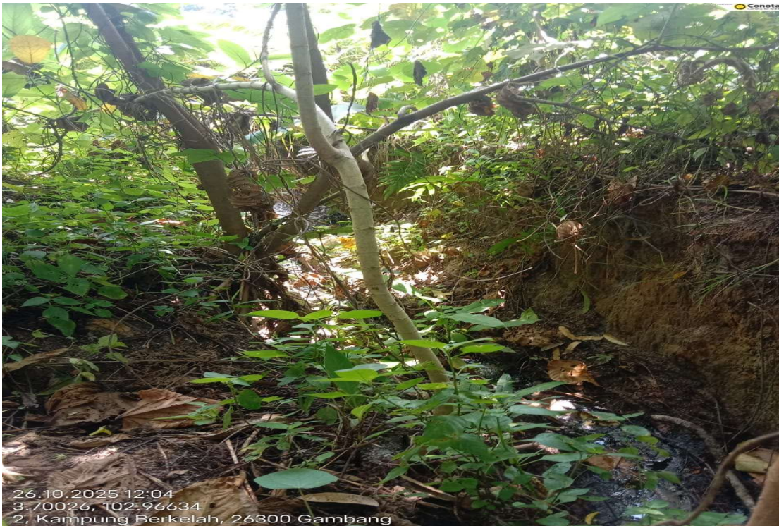
Gambar 7 & 8: Kesan berminyak di alor air dari stesen timbang