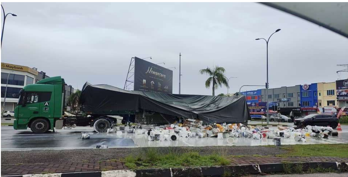
Gambar 2: Keadaan lori pengangkut cat yang terlibat dengan kemalangan