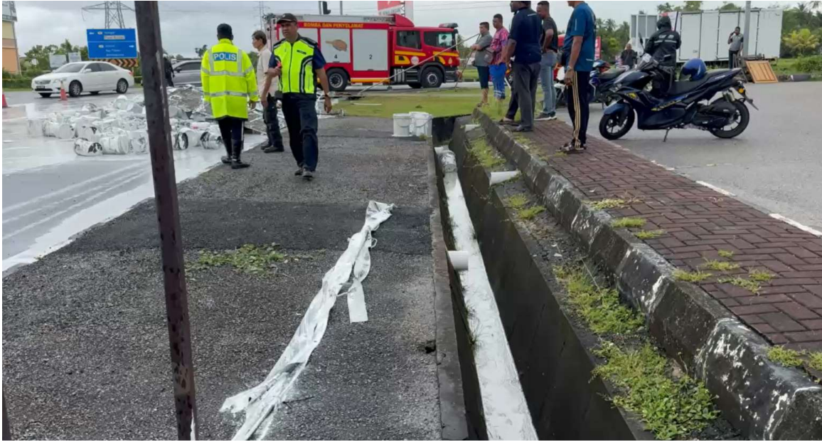
Gambar 3: Terdapat tumpahan cat memasuki longkang tetapi telah dapat dikawal daripada memasuki parit dengan membina sekatan