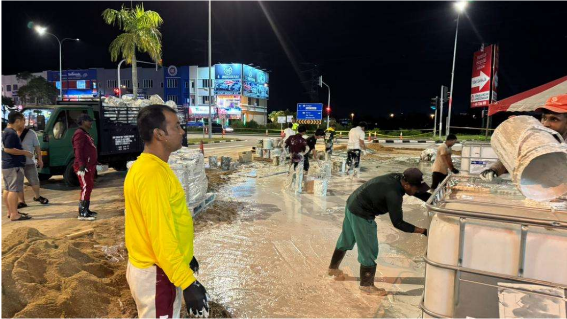
Gambar 4 – 6: Operasi pembersihan dilakukan oleh syarikat pengangkut dan Pentas Flora Sdn Bhd pada 7 November 2025