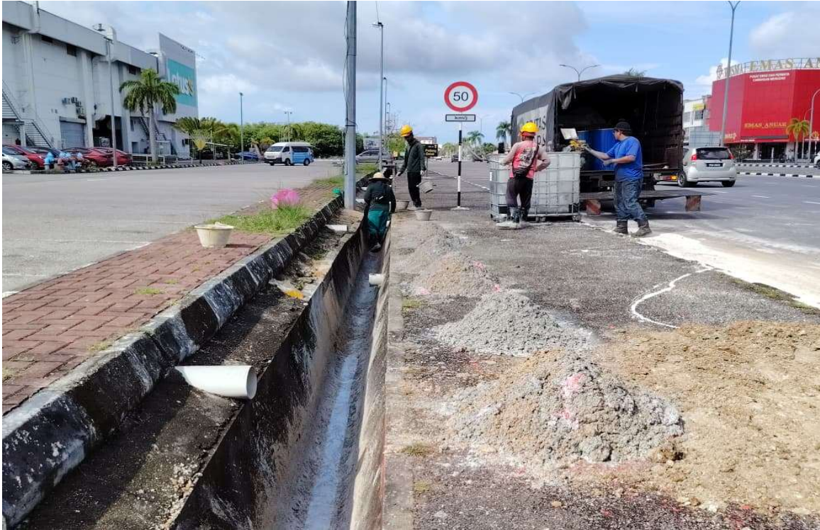
Gambar 6 – 7: Operasi pembersihan oleh syarikat Pentas Flora Sdn. Bhd. diteruskan pada 8 November 2025