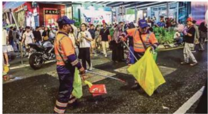
Petugas SWCorp membersihkan sampah di kawasan Bukit Bintang selepas sambutan Ambang Tahun Baharu 2026 di Kuala Lumpur, malam kelmarin.

secara tidak langsung dapat mendidik dan membentuk kesedaran sivik supaya pesalah lebih cakna, bertanggungjawab dan menginsaf kepentingan menjaga kebersihan persekitaran, sekali gus mengurangkan kecenderungan pengulangan kesalahan.