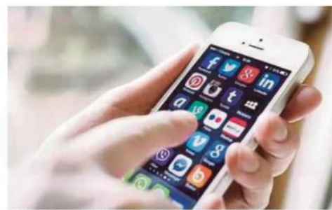
Akta Keselamatan Dalam Talian 2025 akan mengenakan larangan ke atas remaja berusia 16 tahun ke bawah membuka akaun media sosial. (Foto hiasan)