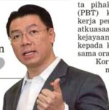
Nga Kor Ming, Menteri Perumahan dan Kerajaan Tempatan

Pegawai penguat kuasa sudah diarahkan untuk melaksanakan undang-undang baharu itu bertujuan memperkukuh kebersihan awam serta tanggungjawab sivik