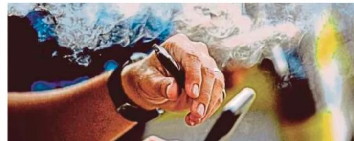
KKM mencadangkan penggunaan vape diharamkan tahun depan.

Susulan peningkatan kes kemudaratan kesihatan membabitkan penggunaan vape yang semakin membimbangkan, Malaysia komited untuk mengharamkan sepenuhnya penggunaan vape pada tahun depan, kemungkinan pada