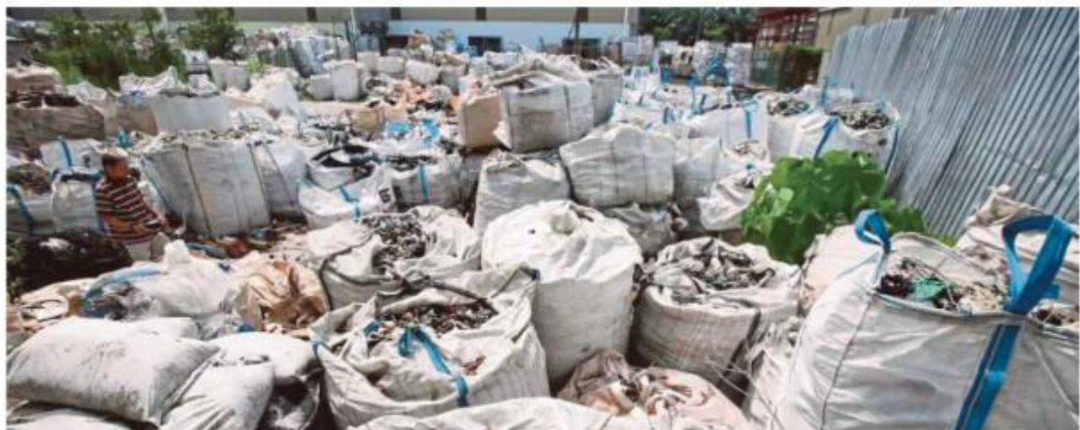
PENGIMPORT sisa plastik perlu memperoleh Certificate of Approval (COA) daripada SIRIM Berhad.

Kebanyakan kes dikesan menggunakan pengiklanan tidak tepat serta memani-polisi kod barangan bagi mengelakkan pemeriksaan terperinci.