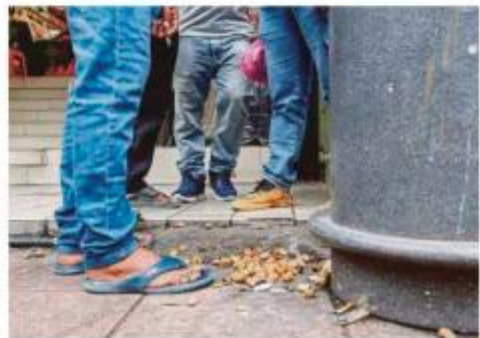
Sampah dibuang merata-rata di kaki lima sekitar Lebah Pudu, Kuala Lumpur.

Kerjasama itu memupuk kepada aktiviti mengutip sisa sampah, mencuci permukaan jalan, membersihkan laluan pejalan kaki serta kawasan tumpuan pengunjung.