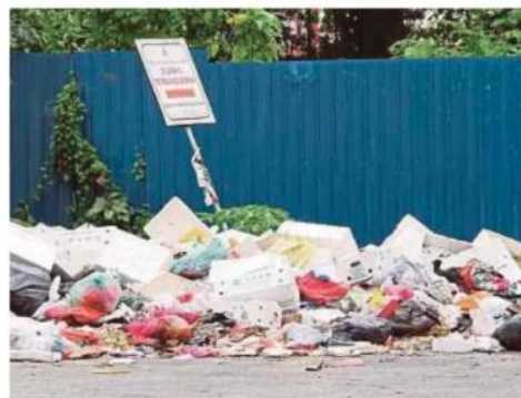
Sikap tidak bertanggungjawab mencemarkan imej bandar serta reputasi negara secara keseluruhan. (Foto hiasan)

Kor Ming menggesa semua pihak supaya lebih bertanggungjawab apabila berada di kawasan awam sama-