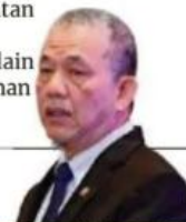
Fadillah Yusof, Timbalan Perdana Menteri/Menteri Peralihan Tenaga dan Transformasi Air

Jabatan Pengairan dan Saliran (JPS) pula melaksanakan 149 projek tebatan banjir memberi perlindungan kepada 1.77 juta penduduk, selain pemuliharaan dan pembangunan sungai di seluruh negara