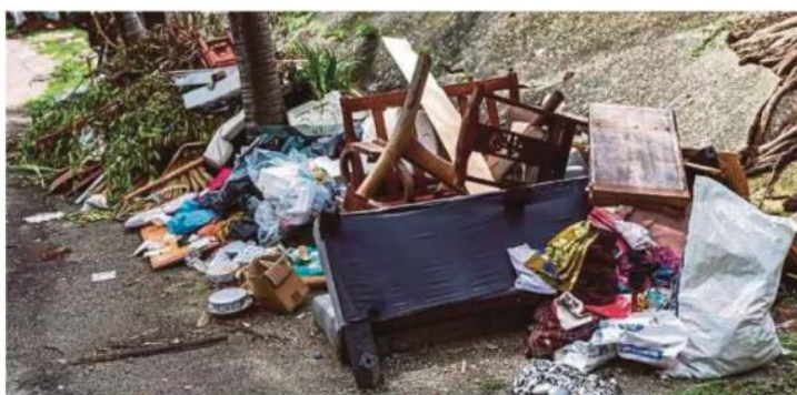
Penguatkuasaan Akta Pengurusan Sisa Pepejal dan Pembersihan Awam (Pindaan) 2025 pada Khamis ini mengenakan Perintah Khidmat Masyarakat hingga 12 jam dan denda hingga RM2,000, kepada orang awam, termasuk pelancong asing yang membuang sampah di tempat awam.