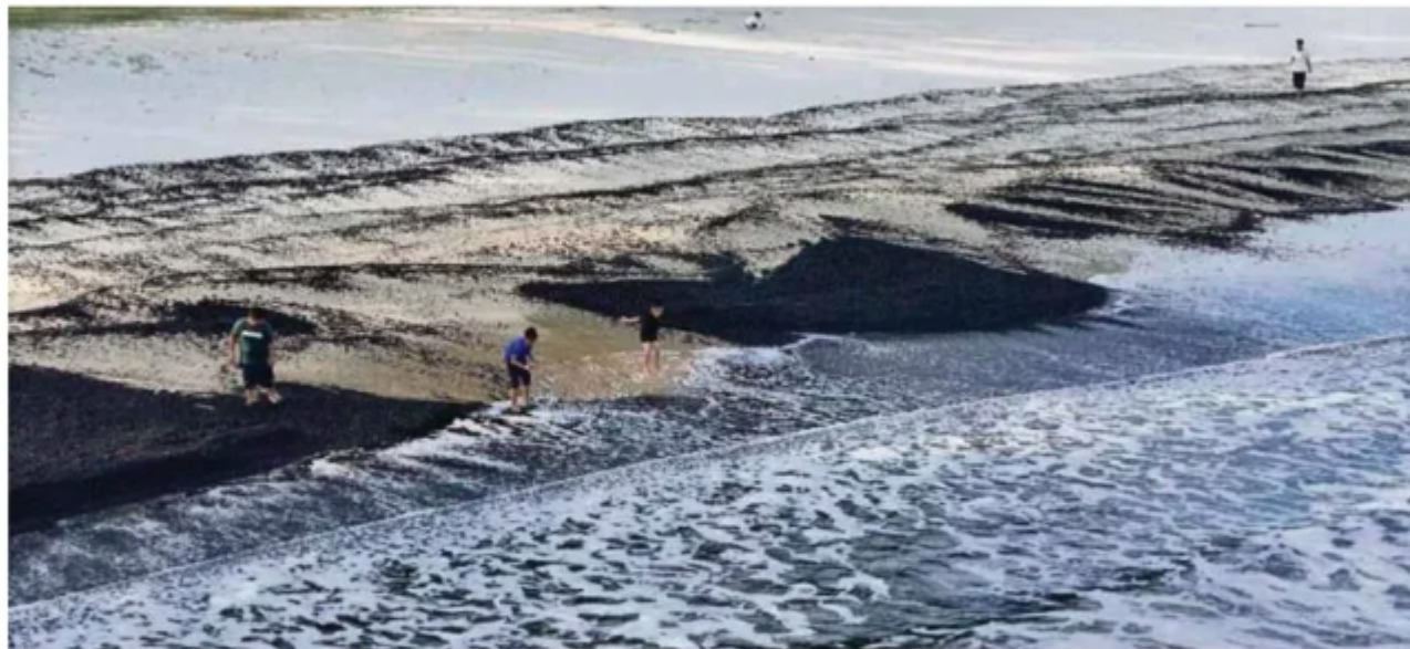
Keadaan Pantai Teluk Kalong yang dicemari arang batu.

Katanya, ketika itu terdapat tempokan hitam di permukaan air laut dalam jarak beberapa me-