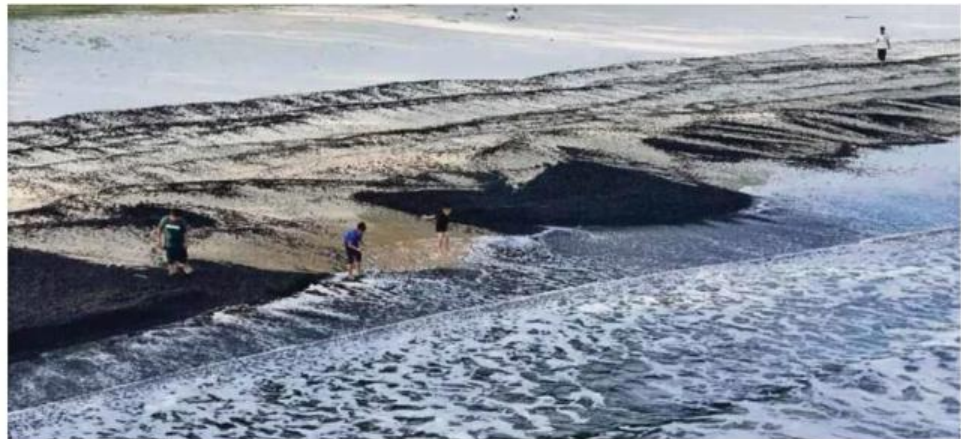
Keadaan Pantai Teluk Kalong yang dicemari arang batu.

Katanya, ketika itu terdapat tumpukan hitam di permukaan air laut dalam jarak beberapa me-