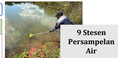
9 Stesen Persampelan Air