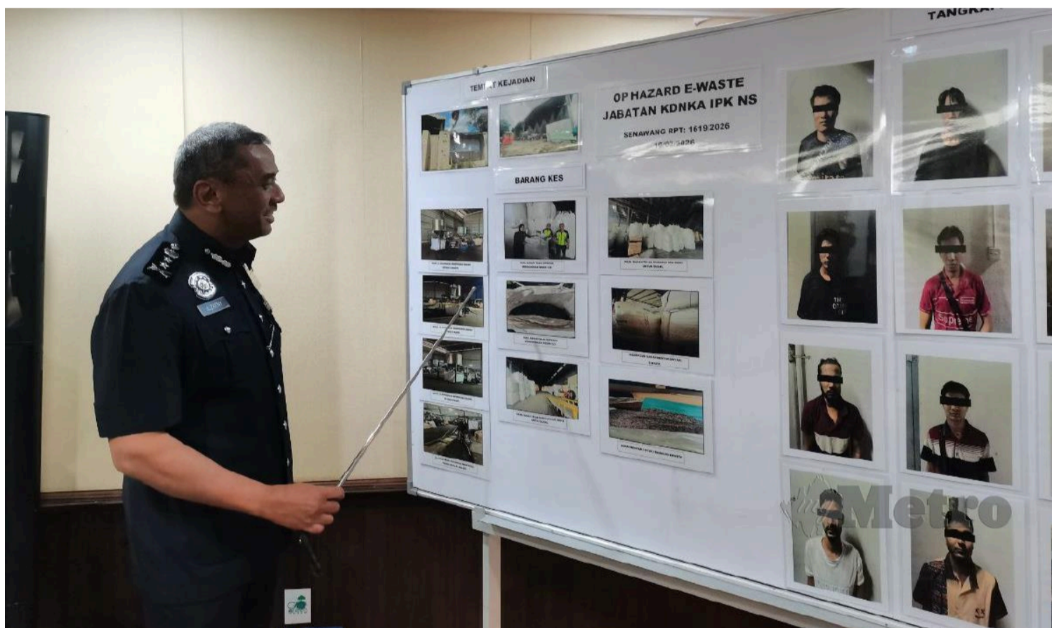
Ketua Polis Negeri Sembilan, Datuk Alzafny Ahmad menunjukkan foto antara sisa plastik dan mesin peleburan yang disita dalam Ops Hazard E-Waste di sebuah kilang di Senawang.

Seremban: Sebuah kilang di Senawang, di sini, yang baru sahaja diserbu pihak berkuasa pada Oktober tahun lalu kerana menjalankan aktiviti peleburan plastik secara haram didapati masih aktif melakukan kegiatan sama.