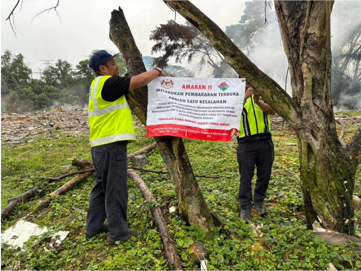
Gambar 5: Pemasangan banner larangan pembakaran terbuka