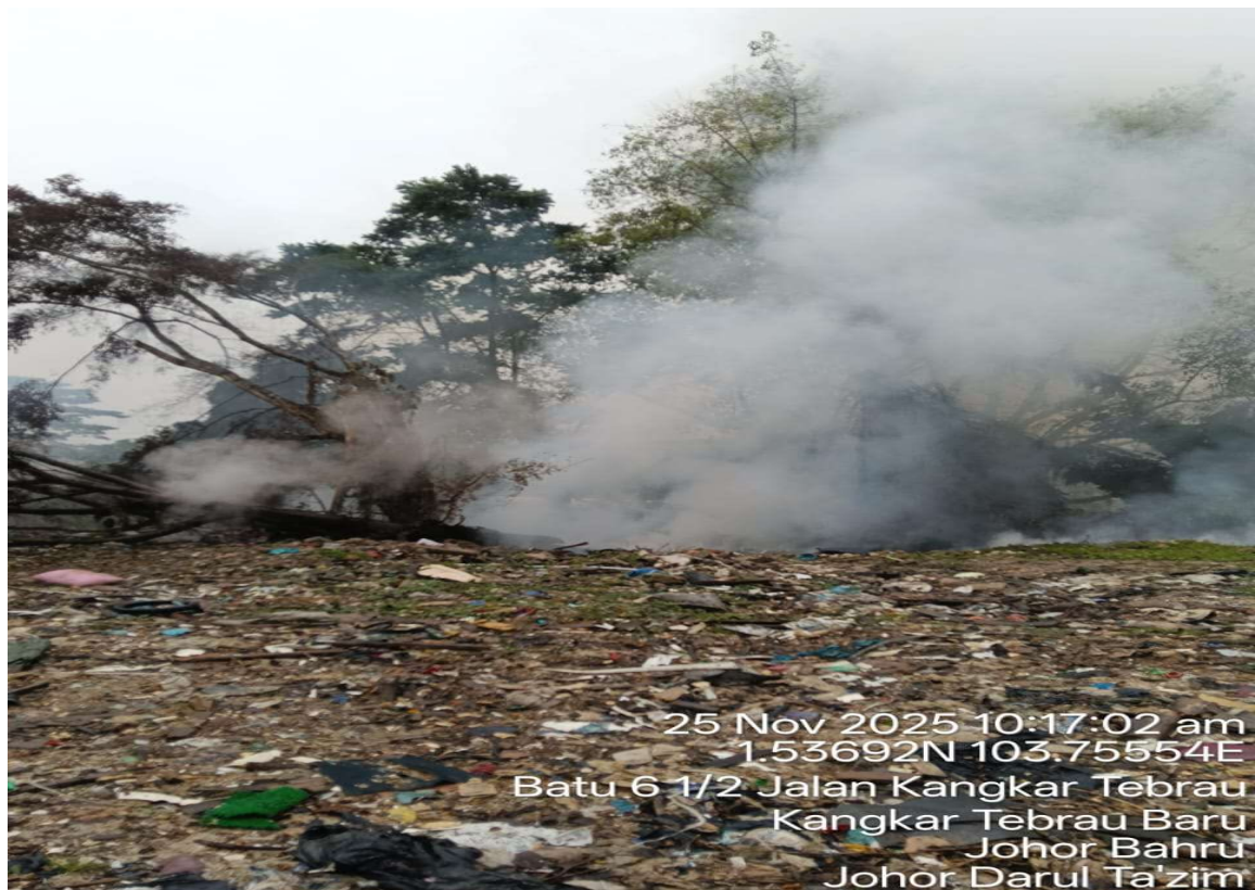
Gambar 2 - 4: Keadaan kebakaran di tapak pelupusan sampah haram yang masih berasap