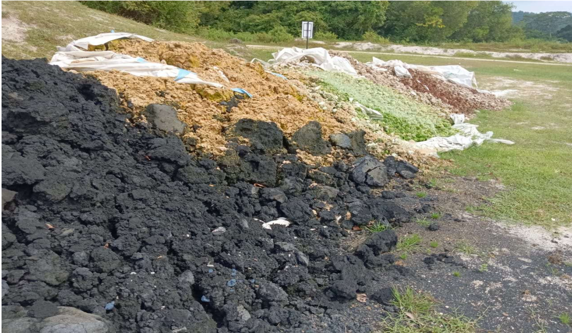
Gambar 3 - 5: Keadaan buangan yang disyaki Buangan Terjadual di tapak pelupusan