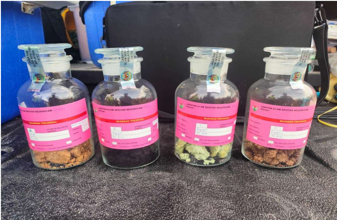
Gambar 8 – 11: Persampelan buangan untuk dianalisis oleh Jabatan Kimia Malaysia