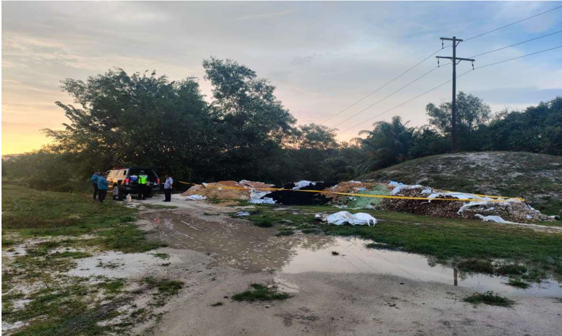
Gambar 6 & 7: Lokasi kejadian telah dikondon untuk mengelak pencerobohan