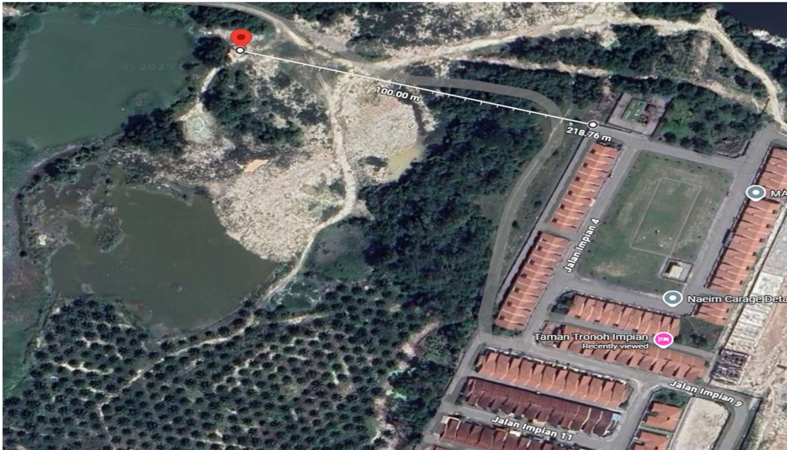
Gambar 1: Semakan Google Map menunjukkan jarak lokasi tapak pelupusan haram dengan Taman Impian lebih kurang 218 meter